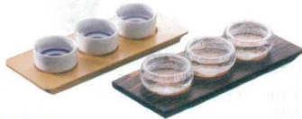
16 利き酒トレイ [STRY-01] E

13-0981-1501 ¥2,300 サイズ:40×40×H45 容量:25cc