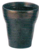
4 窯変天目 焼酎カップ

[SYSK-08] 13-0981-0301 ¥1,200 サイズ:φ80×H110 280cc