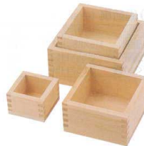
17 枡(ヒノキ材) [BMAS-01] ◇

穴サイズ 白木 φ50(底45)×H6 13-0981-1601 ¥2,200 焼杉 φ52(底50)×H6 13-0981-1602 ¥1,900 サイズ:220×90×H15 ●薬味入れや珍珠3点盛にもご利用いただけます。 ※器は別売です。