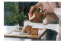
15 以為 盃千代口 [SCH0-01] E

サイズ cc 大 86×86×H120 360 13-0981-1401 ¥5,000 小 72×72×H103 180 13-0981-1402 ¥4,700 ※マークの部分をおさえ、こぼれない様に注いでください。