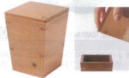
14 以為 日光杉 徳利 [STKR-01] E

サイズ 大 150×150×H26 13-0981-1301 ¥2,600 小 89×89×H26 13-0981-1302 ¥2,500