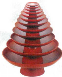
9 (福)DX営業用朱盃 重厚型

[SYSK-20] 13-0981-0801 ¥1,300 サイズ:φ85×H120 300cc