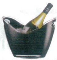
9 ヴィノ ゴンドラ S

[PWNC-33] L 13-0997-0801 ¥2,800 サイズ: 220×225×H270 材質: MS樹脂 容量: レギュラーボトル1本