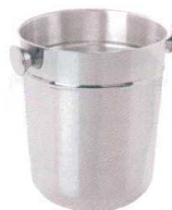
3 ステンレス ワイン・シャンパンクーラー 2本用

[PWNC-25] L 13-0997-0201 ¥2,500 サイズ: 231×224×H209 材質: ステンレス 容量: レギュラーボトル1本 ※P995使用可能です。