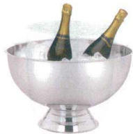
1 ステンレス パーティクーラー

[PWNC-22] L 13-0997-0101 ¥8,000 サイズ: 374φ×H235 材質: ステンレス 容量: レギュラーボトル5~6本 ※P995使用可能です。