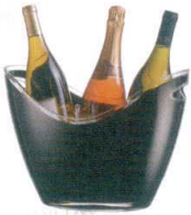
10 ヴィノ ゴンドラ L

[PWNC-34] L 13-0997-0901 ¥2,400 サイズ: 270×200×H200 材質: MS樹脂 容量: レギュラーボトル2本