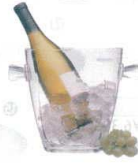
17 プロデザイン アクリル ワインバケツ ラウンドスクエア AB-10

[PWNC-12] 洗 13-0997-1601 ¥14,500 サイズ: φ203×H232 材質: ポリカーボネイト