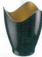
7 ワイン・冷酒クーラー

[PWNC-32] L 13-0997-0701 ¥2,800 サイズ: 200×200×H254 材質: MS樹脂 容量: 日本酒720ml、ワインボトル1本