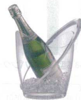
8 オービット ワインクーラー

[PWNC-32] L 13-0997-0701 ¥2,800 サイズ: 200×200×H254 材質: MS樹脂 容量: 日本酒720ml、ワインボトル1本