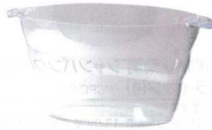
6 アクリルウェーブ パーティクーラー

[PWNC-31] L 13-0997-0601 ¥3,000 サイズ: 388(最大幅468)×283×H230 材質: MS樹脂 容量: レギュラーボトル6本