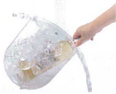
5 スライドイン ワインクーラー

[PWNC-30] L 13-0997-0501 ¥2,800 サイズ: 172×316×H276 材質: MS樹脂 容量: レギュラーボトル1本 ●ボトルが大きく傾く設計で取り出しが非常に手軽です。