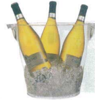
11 ウェーブ ワインクーラー L

[PWNC-35] L 13-0997-1001 ¥3,500 サイズ: 350×265×H257 材質: MS樹脂 容量: レギュラーボトル3~4本