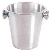
2 ステンレス ワインクーラー

[PWNC-22] L 13-0997-0101 ¥8,000 サイズ: 374φ×H235 材質: ステンレス 容量: レギュラーボトル5~6本 ※P995使用可能です。