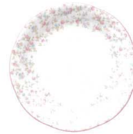
18.5cm プレート 9940L/59315A ¥2,500 D:183・H:18 BC