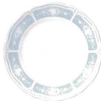
21cm プレート 1507L/94411 ¥2,500 D:210・H:23 WP