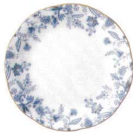
18.5cm プレート 4562L/59315A ¥3,000 D:183・H:18 BC