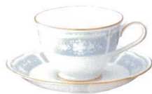
ティー・コーヒー碗皿 (ブルー) 1507L/Y9587A ¥2,500 C:約220 WP