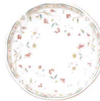
21cm プレート 4409L/59311A ¥3,500 D:211・H:18 BC