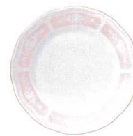
18cm プレート 1507-4L/94415 ¥2,000 D:181 H:20 WP