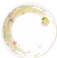
18.5cm プレート 4620L/59315A ¥2,500 D:183・H:18 BC