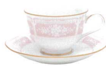
ティー・コーヒー碗皿 (ピンク) 1507-4L/Y9587A ¥2,500 C:約220 WP