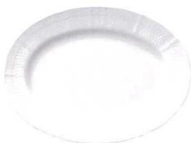
36cm オーバルプラター 1655L/94844 ¥12,000 L:361・W:267・H:31 内箱:1・外箱:6