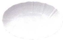
27cm オーバルプレート 1655L/T94846 ¥5,000 L:268・W:170・H:32 内箱:1・外箱:12