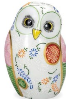
K8-1621 ¥19,800 (税別¥18,000) ● 6号ふくろう・鹿子白盛 幅11.5×奥行11.5×高17cm、紙箱