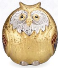
K8-1616 ¥17,600 (税別¥16,000) ● 3.6号丸ふくろう・金 幅10×奥行9.8×高10.4cm、紙箱