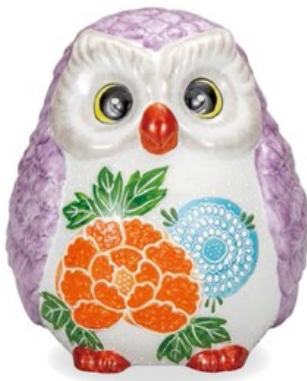
K8-1619 ¥18,700 (税別¥17,000) ● 6号寿ふくろう・紫盛 幅15.5×奥行16×高18cm、紙箱