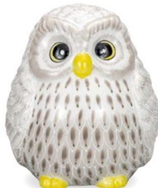
K8-1620 ¥19,800 (税別¥18,000) ● 6号寿ふくろう・白盛黒 幅15.5×奥行16×高18cm、紙箱