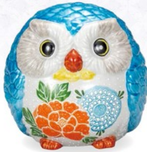
K8-1617 ¥17,600 (税別¥16,000) ● 5号玉ふくろう・青盛 幅15.5×奥行15×高14.5cm、紙箱