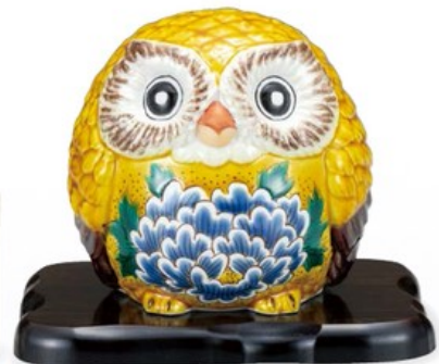
K8-1624 ¥27,500 (税別¥25,000) ● 5号ふくろう・黄彩牡丹 (台・立札付) 柳川孝之 幅15.5×奥行15×高14.5cm、化粧箱