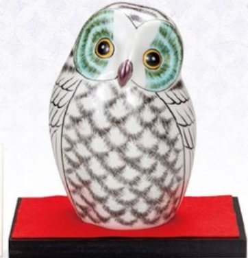
K8-1618 ¥18,150 (税別¥16,500) ● 6号ふくろう・白 (台・敷物・立札付) 幅11.5×奥行11.5×高17cm、紙箱