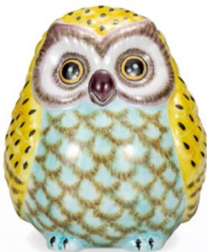
K8-1622 ¥24,200 (税別¥22,000) ● 6号ふくろう・黄釉彩 幅15.5×奥行16×高18cm、紙箱