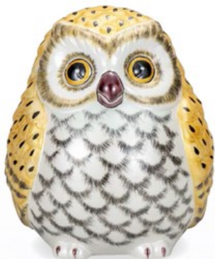
K8-1623 ¥24,200 (税別¥22,000) ● 6号ふくろう・金彩 幅15.5×奥行16×高18cm、紙箱