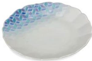
K8-3001 ¥15,400 (税別 ¥14,000) ●■ 5.2号盛皿・紅掛空色・紺青 織窯 径15.7×高2.3cm、化粧箱