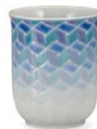
K8-3006 ¥29,700 (税別 ¥27,000) ●■ 湯呑・紅掛空色・紺青 織窯 径7×高8.6cm、化粧箱