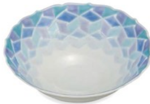
K8-3002 ¥35,200 (税別 ¥32,000) ●■ 5.5号鉢・紅掛空色・紺青 織窯 径16.6×高6.1cm、化粧箱