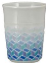
K8-3005 ¥29,700 (税別 ¥27,000) ●■ フリーカップ・紅掛空色・紺青 織窯 径7.6×高10cm、化粧箱