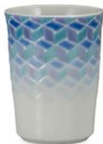
K8-3004 ¥29,700 (税別 ¥27,000) ●■ フリーカップ・紅掛空色・紺青 織窯 径7.6×高10cm、化粧箱