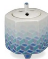
K8-3003 ¥36,300 (税別 ¥33,000) ●■ 3号香炉・紅掛空色・紺青 織窯 径7.7×高9cm、木箱