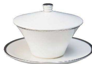
★51399-28852 スープカップ蓋 ¥3,700 D123・H34mm CT/36