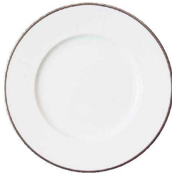
★51399-5120 27cmディナー皿 ¥6,300 D274・H25mm CT/24