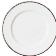
★51399-1086 21cmデザート皿 ¥4,300 D212・H17mm CT/36