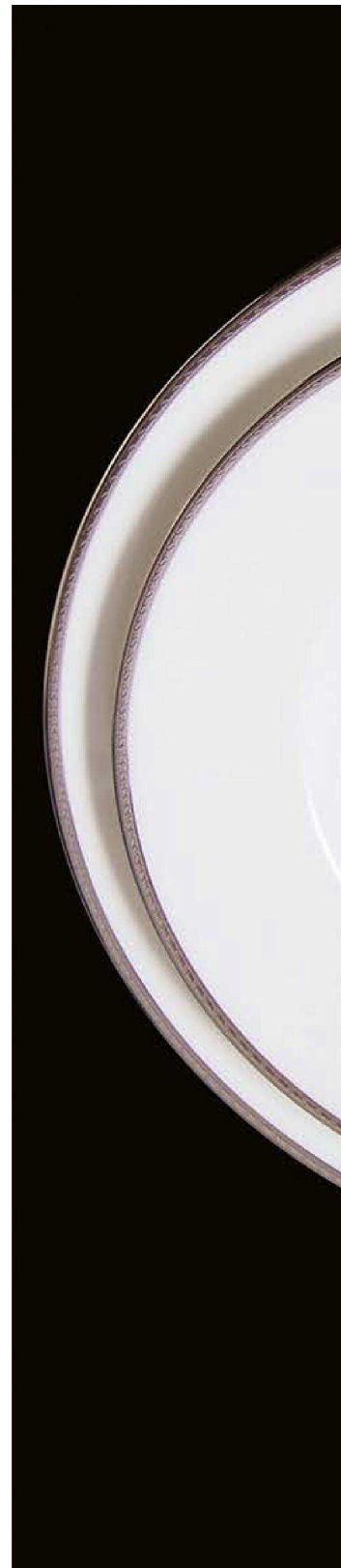
★51399-1217 スーソーサー ¥3,000 D158・H19mm CT/96