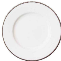
★51399-1582 23cmミート皿 ¥5,300 D231・H22mm CT/36