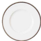
★51399-5132 16cmパン皿 ¥3,100 D166・H14mm CT/48