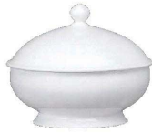
★9000-3333 22cm高台付スープチューリン ¥23,000 D235・H186mm・2,280cc CT/8