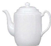
★9000-4294 中国茶土瓶 (L) ¥17,000 L212・S121・H194mm 1,570cc CT/8