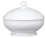
★9000-3334 20cm高台付スープチューリン ¥21,000 D215・H168mm・1,700cc CT/8