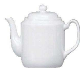
★9000-4295 中国茶土瓶 (S) ¥12,000 L200・S119・H163mm 1,130cc CT/8