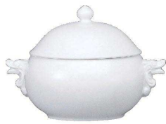
★9000-3212 スープチューリンA (L) ¥38,000 L332・S254・H228mm・4,700cc CT/4