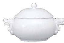
★9000-3225 スープチューリンA (S) ¥32,000 L292・S215・H179mm・2,830cc CT/4