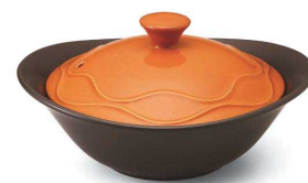
フタ付クックボウル(オレンジ) ¥3,300(税込) 本体価格 ¥3,000 (直径23cm・800cc) <225×240×90> 品番:41115-33021 ※オリジナルレシピカード付き