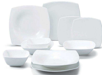
10ピース・スターターセット ¥27,500(税込) 本体価格 ¥25,000 29cmスクエアプレート2/21cmスクエアプレート2/28cm/スタプレート2 15cmスクエアボウル2/20cmスクエアボウル2 <270×465×130> 品番:50481-24445