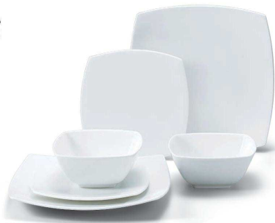
6ピース・ベーシックセット ¥13,200(税込) 本体価格 ¥12,000 29cmスクエアプレート2/21cmスクエアプレート2/15cmスクエアボウル2 <270×275×155> 品番:50481-23210