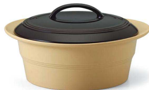
クックポット ¥5,500(税込) 本体価格 ¥5,000 (直径23cm・1400cc) <230×240×100> ※オリジナルレシピカード付 品番:41252-33082