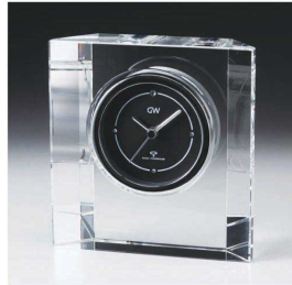
■【ステラ】電波時計 ¥27,500(税込) 本体価格 ¥25,000 幅16cm・奥行4.6cm・高さ16.5cm 品番:GW1000-11214