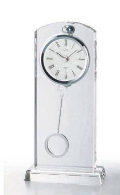
■【セレナ】ペンドラムクロック ¥22,000(税込) 本体価格 ¥20,000 幅14cm・奥行6.2cm・高さ28.4cm 品番:GW1000-11017