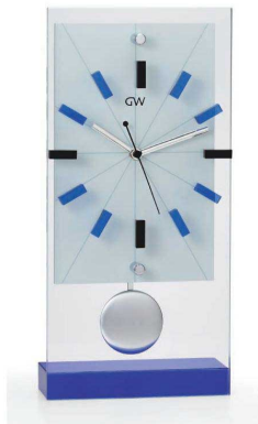
■【リッツ】振り時計(スタンド) ¥16,500(税込) 本体価格 ¥15,000 幅17cm・奥行7.6cm・高さ35.6cm 品番:GW1000-11075