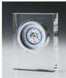
■【モリス】世界時計 ¥27,500(税込) 本体価格 ¥25,000 幅13.6cm・奥行4.6cm・高さ18cm 品番:GW1000-11064