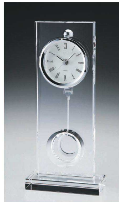
■【ウィンドウ】ペンドラムクロック ¥33,000(税込) 本体価格 ¥30,000 幅14cm・奥行6.2cm・高さ31cm 品番:GW1000-11036