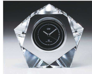
■【マクロス】電波時計 ¥33,000(税込) 本体価格 ¥30,000 幅20cm・奥行4.6cm・高さ19cm 品番:GW1000-11215