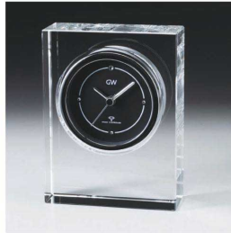
■【ノヴァ】電波時計 ¥22,000(税込) 本体価格 ¥20,000 幅12.5cm・奥行4.6cm・高さ16.5cm 品番:GW1000-11213