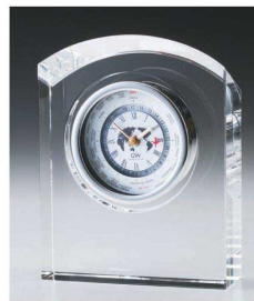
■【カーヴ】世界時計 ¥33,000(税込) 本体価格 ¥30,000 幅15cm・奥行4.6cm・高さ19cm 品番:GW1000-11065