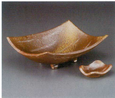
01001-181 手造り備前風角尺一盛鉢 10,000円 (28.8×21.4×8.6cm) 01002-181 備前風長角千代口 1,300円 (9.8×7.8×2.9cm)