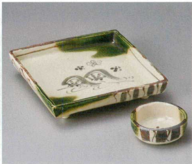
01003-121 織部水車四方刺身鉢 9,000円 (18×4cm) 01004-121 織部梅紋千代口 2,000円 (8×3cm)