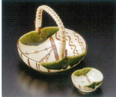
01007-461 手造織部(手付)まゆ形刺身鉢 7,200円 (15×13.5×5cm) 01008-461 手造織部まゆ形小々井 2,700円 (7×6×2.5cm)