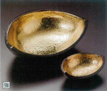
01011-461 黒ちらし内金塗5.5半月形井 7,600円 (19×13.5×6cm) 01012-461 黒ちらし内金塗半月形小々井 2,900円 (10×7×3.5cm)