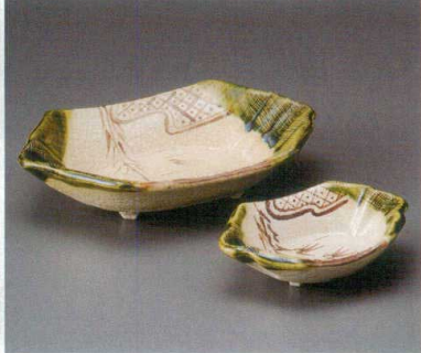
01009-451 織部舟型刺身鉢(手造り) 7,000円 (19.5×13×4.5cm) 01010-451 織部舟型千代口(手造り) 2,300円 (12×8.5×4cm)