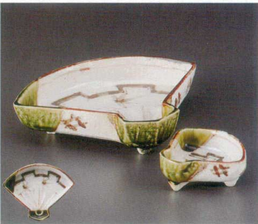
01005-121 織部扇面向付 7,700円 (18×15×5cm) 01006-121 織部扇面千代口 2,300円 (8.5×7.5×3.5cm)