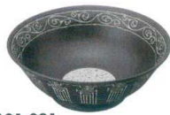
A0601-021 6.3ラーメン丼 1,270円 (19.3×7.2cm)