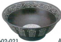
A0602-021 6.8ラーメン丼 1,770円 (21.3×8.8cm)