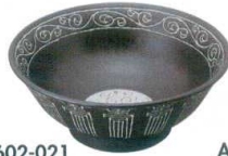
A0602-021 6.8ラーメン丼 1,770円 (21.3×8.8cm)