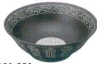
A0601-021 6.3ラーメン丼 1,270円 (19.3×7.2cm)