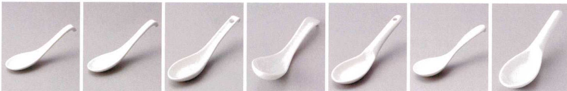
A2133-311 ラーメンレンゲ 540円 (17.2×5×3.5cm) A2134-161 白ラーメンレンゲ 500円 (17.6×5.2cm) A2135-081 白6.0掛ラーメンレンゲ 500円 (17.5×4.5cm) A2136-291 手平反レンゲ大 500円 (15.3×4.3cm) A2137-051 白カギ付レンゲ 480円 (16.5×4.7cm) A2138-321 多用レンゲ 450円 (16.7×5.4cm) A2139-091 両掛レンゲ 390円 (13.7×4.4×4cm)