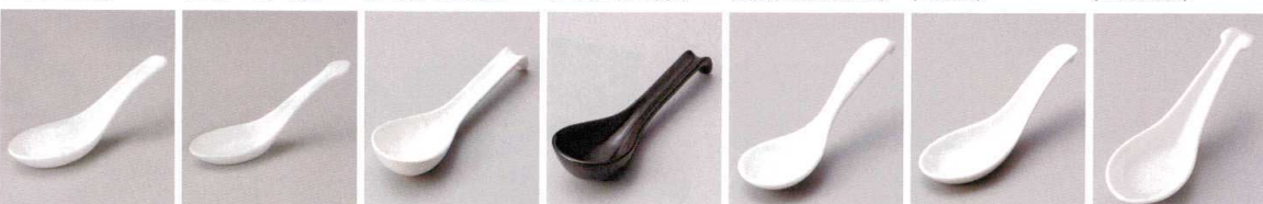
A2147-191 白中レンゲ 360円 (14×4.7cm) A2148-191 白並レンゲ 240円 (14×4.3cm) A2149-201 ひっかけレンゲ白 450円 (16.2×4.7cm) A2150-201 ひっかけレンゲ黒 450円 (16.2×4.7cm) A2151-161 白多用レンゲ 290円 (14.5×4.8cm) A2152-321 白カギレンゲ 270円 (14.1×4.6cm) A2153-021 手付カギ付レンゲ 270円 (15×4.7cm)