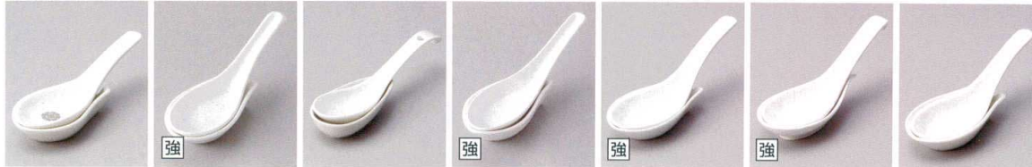
A2101-331 黄翔鳳レンゲ 1,150円 (14.8×4.8cm) A2103-461 白掛さじ 720円 (14×4.5×5cm) A2105-13-311 丸型ラーメンレンゲ(大) 660円 (19cm) A2107-451 白レンゲ(大) 570円 (15.6×4.7×4.2cm) A2109-311 白強化中匙 520円 (14.4×4.7×5cm) A2111-321 カギレンゲ 450円 (15×4.8cm) A2113-311 白上匙 350円 (14×4.5×4.6cm) A2102-331 黄翔鳳レンゲ台 1,200円 (9.5×5.8×2.5cm) A2104-461 白さじ受台 840円 (9×5.5×2cm) A2106-311 丸型ラーメン受台(大) 380円 (10.8×5.9×2.5cm) A2108-451 白受台 480円 (9.5×5.7×2cm) A2110-311 白強化中匙台 460円 (9×5.3×1.9cm) A2112-321 カギレンゲ受台 440円 (10.8×5.7cm) A2114-311 白上匙台 430円 (9×5.7cm)