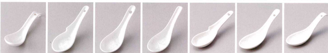
A2140-131 白ラーメンレンゲ(小) 360円 (15.5×4.5cm) A2141-091 ハラ掛穴レンゲ 380円 (14.3×4.5×5cm) A2142-091 穴チリレンゲ 400円 (14.5×4.4×5cm) A2143-091 掛レンゲ 380円 (14.8×4.7×5cm) A2144-311 白カギ付レンゲ 330円 (15.5×4.3×3.7cm) A2145-311 白穴匙 310円 (13.5cm) A2146-161 白反レンゲ 300円 (14×4.5cm)