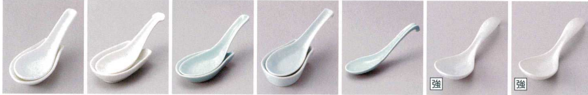
A2115-091 4.0レンゲ厚口 380円 (12.7×4.6×4.1cm) A2117-311 白並匙 240円 (13cm) A2119-19-311 青磁上匙 430円 (14cm) A2121-541 青磁カギレンゲ 380円 (14.5×4.5×3.5cm) A2123-311 青磁ラーメンレンゲ 610円 (17.2×5×3.5cm) A2124-461 青地スプーン 1,060円 (14×4.5×3cm) A2125-461 白スプーン 1,060円 (14×4.5×3cm) A2116-091 白上受台小 480円 (9×5.5×2cm) A2118-311 白並匙台 300円 (8.5×5.5cm) A2120-19-311 青磁上匙台 520円 (5.7×9cm) A2122-541 青磁レンゲ台 380円 (8×5.8×2.2cm)