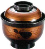
耐 A5709-761 白檀瓢箪33乱筋小吸椀 2,650円 (10×9.8cm・220cc)TA・硬・耐