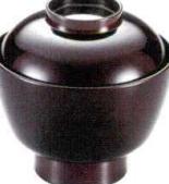
耐 A5719-761 白檀帯33石州小吸椀 2,500円 (9.8×9.5cm・245cc)木合・硬・耐