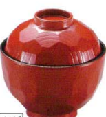
耐 A5725-761 春慶32亀甲小吸椀 950円 (9.4×9.8cm・220cc)A・ウ