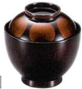
耐 A5707-761 白檀日月32小吸椀 3,000円 (9.7×10cm・245cc)TA・硬・耐