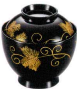
耐 A5708-761 唐草32小吸椀 2,900円 (9.7×10cm・245cc)TA・硬・耐