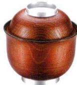
耐 A5710-761 銀帯溜系筋木目小吸椀 3,000円 (9.5×9.9cm・240cc)木合・HC・耐