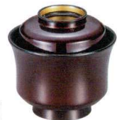
耐 A5716-761 溜立金30石州小吸椀 2,600円 (8.8×8.3cm・160cc)木合・硬・耐