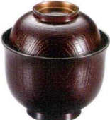
耐 A5714-761 溜立金糸筋木目小吸椀 2,400円 (9.5×9.9cm・240cc)木合・硬・耐