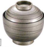
耐 A5702-761 銀渦31小吸椀 3,000円 (9.1×9.3cm・195cc)TA・HC・耐