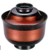
耐 A5711-761 白檀帯天山小吸椀 2,500円 (10×9.2cm・255cc)木合・硬・耐