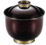
耐 A5704-761 溜金冠 30リボン椀 2,800円 (8.6×8.8cm・185cc)木合・硬・耐