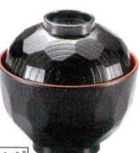
耐 A5724-761 板塗32亀甲小吸椀 1,100円 (9.4×9.8cm・220cc)A・ウ