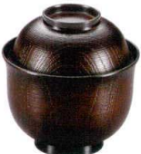
耐 A5713-761 板塗系筋木目小吸椀 2,600円 (9.5×9.9cm・240cc)木合・ウ・耐