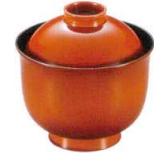
耐 A5705-761 春慶 30リボン椀 2,500円 (8.6×8.8cm・185cc)木合・ウ・耐