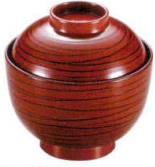
耐 A5701-761 根来渦31小吸椀 3,500円 (9.1×9.3cm・195cc)TA・HC・耐