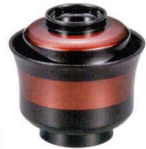
耐 A5717-761 溜立金33石州小吸椀 2,600円 (9.8×9.5cm・245cc)木合・硬・耐