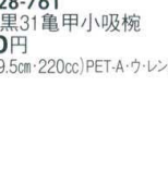
耐 A5730-761 朱内黒31亀甲小吸椀 780円 (9.2×9.5cm・220cc)PET-A・ウ・レンジ耐