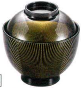
耐 A5706-761 黒新武蔵野32小吸椀 3,650円 (9.7×10cm・245cc)TA・HC・耐