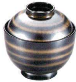
耐 A5703-761 黒銀金輪31小吸椀 2,800円 (9.1×9.3cm・195cc)TA・HC・耐