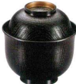
耐 A5715-761 黒立金糸筋木目小吸椀 2,100円 (9.5×9.9cm・240cc)木合・硬・耐