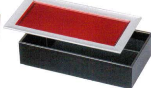
A6109-761 銀地内ワイン 75 長手前菜皿 2,900円 (21.8×11.5×1.2cm) A・SH A6110-761 総黒 75 長手弁当(親) 1,950円 (21.8×11.5×5.6cm) A・ウ