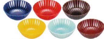
耐 レンジ A6126-761 瑠璃 26菊小鉢 680円 (7.9×3.3cm) PET・A・ウ・耐・レンジ A6127-761 赤 26菊小鉢 680円 (7.9×3.3cm) PET・A・ウ・耐・レンジ A6128-761 溜 26菊小鉢 680円 (7.9×3.3cm) PET・A・ウ・耐・レンジ A6129-761 黄 26菊小鉢 680円 (7.9×3.3cm) PET・A・ウ・耐・レンジ A6130-761 青磁 26菊小鉢 680円 (7.9×3.3cm) PET・A・ウ・耐・レンジ A6131-761 茜朱 26菊小鉢 680円 (7.9×3.3cm) PET・A・ウ・耐・レンジ