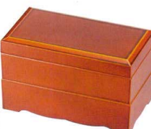
総春慶 60雅弁当 A6122-761 (二段) 11,800円 (18×10.1×11.4cm) 木合・SH・耐 A6123-761 (蓋) 3,900円 (18×10.1×2.6cm) 木合・SH・耐 A6124-761 (中合親) 3,900円 (18×10.1×4.3cm) 木合・SH・耐 A6125-761 (足付親) 4,000円 (18×10.1×5.1cm) 木合・SH・耐