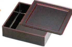
溜(漆風塗)裏黒 65漆遊 A6138-761 角皿 耐 3,000円 (20×20×1.4cm) TA・SH・耐 A6139-761 重深親 4,600円 (19.6×19.6×6.1cm) A・SH