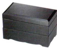
黒石目内黒 60雅弁当 A6118-761 (二段) 7,800円 (18×10.1×11.4cm) 木合・ウ・耐 A6119-761 (蓋) 2,400円 (18×10.1×2.6cm) 木合・ウ・耐 A6120-761 (中合親) 2,600円 (18×10.1×4.3cm) 木合・ウ・耐 A6121-761 (足付親) 2,800円 (18×10.1×5.1cm) 木合・ウ・耐