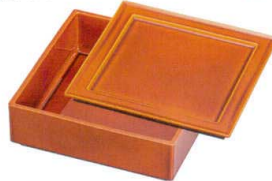
春慶(漆風塗)裏黒 65漆遊 A6136-761 角皿 耐 3,000円 (20×20×1.4cm) TA・SH・耐 A6137-761 重深親 4,600円 (19.6×19.6×6.1cm) A・SH