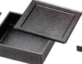
A6148-761 黒石目 65漆遊 角皿 耐 1,800円 (20×20×1.4cm) TA・HC・耐 A6149-761 黒石目 65漆遊 重 深親 2,950円 (19.6×19.6×6.1cm) A・HC