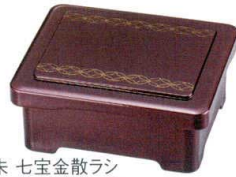
A6103-761 溜内朱 七宝金散ラン 2,800円 (16.8×14.2×7.8cm) TA・HC・耐 A6104-761 DX足付井重 3,950円 (18.1×15.2×8.1cm) TA・HC・耐