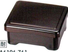
A6106-761 溜内朱 足付井重 2,800円 (16.8×14.2×7.8cm) TA・ウ・耐