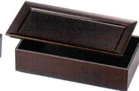
A6111-761 溜漆風塗裏黒 75長手前菜皿 2,150円 (21.8×11.5×1.2cm) A・SH A6112-761 溜漆風塗内裏黒 75長手弁当(親) 2,800円 (21.8×11.5×5.6cm) A・SH