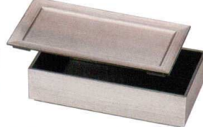
A6113-761 銀木目 75長手前菜皿 1,800円 (21.8×11.5×1.2cm) A・ウ A6114-761 銀木目内黒 75 長手弁当(親) 2,700円 (21.8×11.5×5.6cm) A・ウ