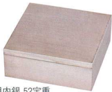
銀木目内銀 52宝重 A6107-761 (蓋・親) 3,900円 (15.8×15.8×6.3cm) A・ウ A6108-761 (親) 2,100円 (15.8×15.8×5cm) A・ウ