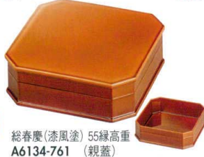
総春慶(漆風塗) 55縁高重 A6134-761 (親蓋) 6,900円 (17.2×17.2×6cm) A・SH A6135-761 (親) 3,700円 (17.2×17.2×5.5cm) A・SH