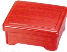
A6105-761 ワインカスリ内黒 足付井重 3,800円 (16.8×14.2×7.8cm) TA・HC・耐