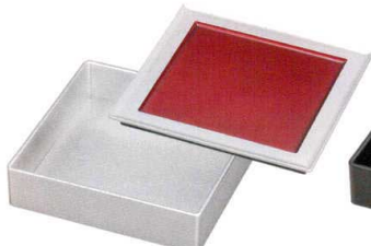
A6140-761 銀帯内ワイン(漆風塗) 65漆遊角皿 3,200円 (20×20×1.4cm) TA・SH・耐 A6141-761 銀石目 65漆遊重 深親 4,200円 (19.6×19.6×6.1cm) A・HC