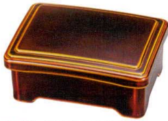
A6101-761 春慶内朱 大型井重 9,000円 (18.8×11.5×4.4cm) A・漆 A6102-761 春慶(漆風塗)内朱 大型井重 6,500円 (18.8×11.5×4.4cm) A・SH