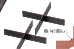
十字仕切(組) A6152-761 6.5寸用 400円 (18.3×18.3×3cm) ABS A6153-761 7.5寸用 460円 (21×21×3.5cm) ABS