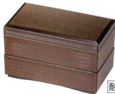
溜内黒 60千筋弁当 A6115-761 (二段) 4,800円 (18×10×11cm) A・ウ A6116-761 (蓋) 1,500円 (18×10×2.1cm) A・ウ A6117-761 (親) 1,650円 (18×10×4.8cm) A・ウ