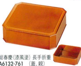
総春慶(漆風塗) 長手折重 A6132-761 (蓋・親) 8,000円 (20×18.5×6.5cm) A・SH A6133-761 (親) 4,200円 (20×18.5×5.9cm) A・SH