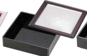
A6144-761 銀地帯溜 65漆遊角皿 耐 2,800円 (20×20×1.4cm) TA・HC・耐 A6145-761 総黒 65漆遊重 浅親 2,400円 (19.6×19.6×5.5cm) A・ウ