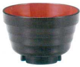
A6805-561 [TA] (小) ロク口重ね椀 黒内朱 650円 (9.9×6.7cm・360cc) 洗浄機OK