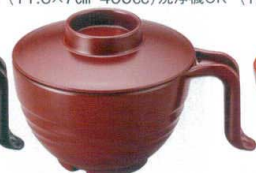
A6828-561 [TA] 手付スープ椀 総銀朱 (フタ・本体) 2,500円 (11.3×15×9.5cm・440cc)