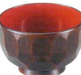
A6818-561 [TA] 3.6寸 亀甲木目汁椀 栃内朱 1,050円 (10.9×7cm・380cc) 洗浄機OK