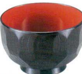
A6817-561 [TA] 3.6寸 亀甲木目汁椀 黒内朱 850円 (10.9×7cm・380cc) 洗浄機OK