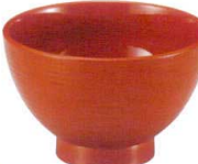
A6821-561 [A] 4寸 乱筋木目井 総洗朱 750円 (12×7.7cm・470cc)