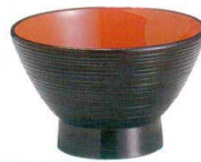
宝生汁椀黒内朱 A6808-561 [A] 3.6寸 650円 (11×7cm・260cc) A6809-561 [A] 3.8寸 700円 (11.7×7cm・300cc)