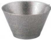
A6802-561 [TA] ボヌールカップ 総銀雅 3,100円 (10.8×6.4cm・300cc)