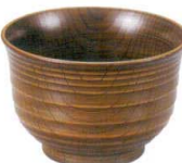
A6814-561 [A] 千段木目汁椀 総栃刷毛目 1,600円 (11×7.4cm・400cc)