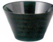
A6803-561 [TA] ボヌールカップ ブラック 950円 (10.8×6.4cm・300cc) 洗浄機OK