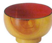
A6816-561 [TA] 布袋汁椀 花梨内朱 1,400円 (11×7cm・370cc)