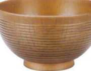
A6826-561 [PET] 4.5寸 千筋タスク椀ケヤキ 1,800円 (13.7×7.7cm・570cc) 洗浄機OK