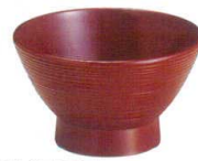
宝生汁椀吟朱 A6810-561 [A] 3.6寸 650円 (11×7cm・260cc) A6811-561 [A] 3.8寸 700円 (11.7×7cm・300cc)