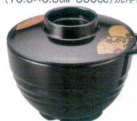
A6827-561 [TA] 手付スープ椀 黒扇面内黒 (フタ・本体) 3,150円 (11.3×15×9.5cm・440cc)