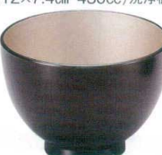
A6830-561 [A] 九頭竜汁椀 黒内銀溜 1,300円 (11.8×8.6cm・500cc)