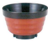
A6806-561 [TA] (小) ロク口重ね椀 朱帯黒 750円 (9.9×6.7cm・360cc) 洗浄機OK