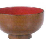
A6823-561 [TA] 3.8寸 木目汁椀 ケヤキ内朱 1,350円 (11.6×7cm・400cc) 洗浄機OK