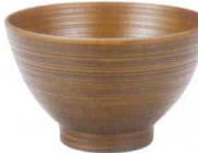
A6825-561 [PET] 4寸 刷毛筋タスク椀ケヤキ 1,450円 (12×7.4cm・430cc) 洗浄機OK