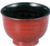
A6813-561 [TA] 3.3寸 美里汁椀 朱木目 850円 (10×6.9cm・380cc) 洗浄機OK