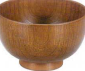
A6824-561 [TA] 4寸 木目汁椀 内外ケヤキ 1,550円 (12.1×7.5cm・500cc) 洗浄機OK