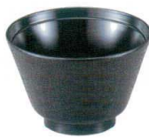
A6807-561 [TA] 3.3寸 布目汁椀 黒 700円 (10.4×6.5cm・230cc) 洗浄機OK 段有