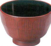
A6819-561 [TA] 3.6寸 ハツリ亀甲汁椀 銀朱 1,250円 (11×7.2cm・400cc) 洗浄機OK