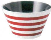
A6801-561 [TA] エスポワールカップ 白朱パール 1,700円 (10.8×6.4cm・300cc) 洗浄機OK