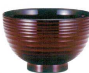
A6820-561 [A] 3.8寸 四季椀 うるみ千筋内黒 650円 (11.4×7.1cm・400cc)