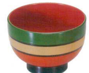
A6815-561 [A] 寿汁椀 歌舞伎内朱 1,350円 (10.4×7.3cm・350cc)