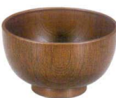
A6822-561 [TA] 3.5寸 木目汁椀 内外ケヤキ 1,100円 (10.6×6.3cm・300cc) 洗浄機OK