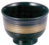
A6812-561 [TA] 3.3寸 美里荒筋汁椀紫金かすみ 1,300円 (10×6.9cm・380cc) 洗浄機OK