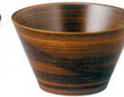
A6804-561 [TA] ボヌールカップ 総栃刷毛目 1,800円 (10.8×6.4cm・300cc) 洗浄機OK