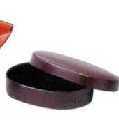
A7320-561 [M]小判楊枝入れ 茶乾漆 1,400円 (9.5×6.5×2.4cm)