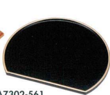
A7302-561 [A]半月銘々皿 黒天金5.5寸 1,450円 (16.5×13.7×0.9cm)