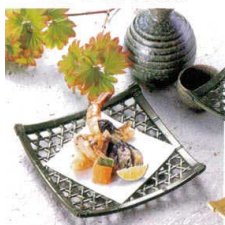
[A]6寸角竹皿 A7331-561 グリーン 950円 (16.6×16.6×3cm) A7332-561 白木 1,300円 (16.6×16.6×3cm)