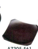
A7305-561 [A]隅切銘々皿 溜木目 1,050円 (12×12×1.3cm)