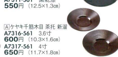
[A]ケヤキ千筋木目 茶托 新溜 A7316-561 3.6寸 600円 (10.3×1.6cm) A7317-561 4寸 650円 (11.7×1.8cm)