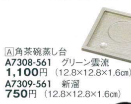
[A]角茶碗蒸し台 A7308-561 グリーン雲流 1,100円 (12.8×12.8×1.6cm) A7309-561 新溜 750円 (12.8×12.8×1.6cm)