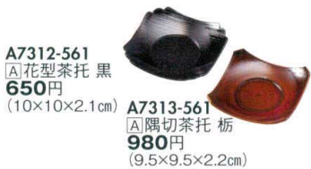
A7312-561 [A]花型茶托 黒 650円 (10×10×2.1cm)