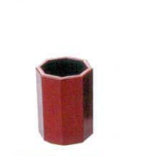
A7322-561 [A]八角妻楊枝入れ ワインパール天朱 570円 (4×4×5.6cm)