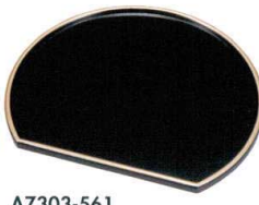
A7303-561 [A]半月銘々皿 黒天金6寸 1,650円 (18.5×15.8×1cm)