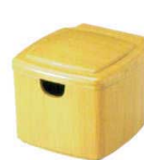
A7326-561 [A]隅丸ガリ入れ 白木塗(切込有) 2,400円 (10×11.1×8.8cm)