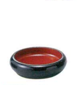
A7323-561 [A]D.Xタイプ型のぞき 黒内朱 530円 (9.5×2.5cm)