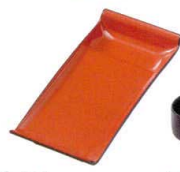
A7319-561 [A]のり皿 朱天黒 1,000円 (17.8×8×2.2cm)