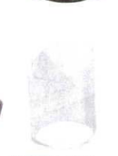
A7321-561 [AC]伝票立て クリア(底板付) 550円 (4.7×7cm)