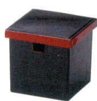
A7324-561 [A](小)角ガリ入れ 黒淵朱(切込有) 1,850円 (11×11×10.9cm)