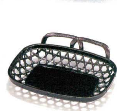
[A]四方片かご 茶パール A7337-561 4.5寸 560円 (13.6×10.3×3.8cm) A7338-561 5.8寸 750円 (17.5×13.2×4.5cm) A7339-561 7寸 850円 (21.2×16×5.3cm)