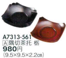
A7313-561 [A]隅切茶托 栃 980円 (9.5×9.5×2.2cm)