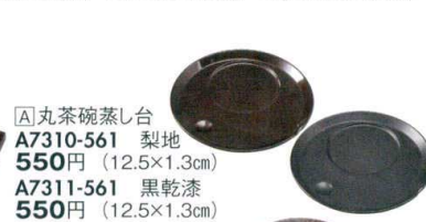
[A]丸茶碗蒸し台 A7310-561 梨地 550円 (12.5×1.3cm) A7311-561 黒乾漆 550円 (12.5×1.3cm)