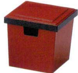
A7325-561 [A](大)角ガリ入れ 朱淵黒(切込有) 2,600円 (12×12×11.6cm)