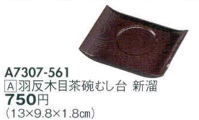
A7307-561 [A]羽反木目茶碗むし台 新溜 750円 (13×9.8×1.8cm)