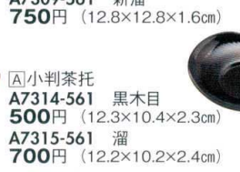
[A]小判茶托 A7314-561 黒木目 500円 (12.3×10.4×2.3cm) A7315-561 溜 700円 (12.2×10.2×2.4cm)