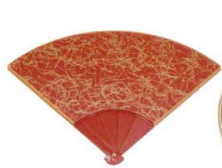
A7301-561 [A]扇面皿 朱金乱糸 950円 (15.1×11.2×0.5cm)