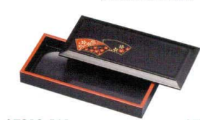
A7318-561 [A]徳川のり入れ 黒扇面 1,500円 (16×7.5×2.8cm)