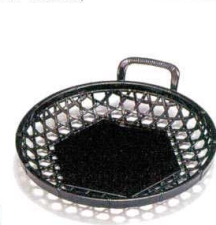
[A]片手かご 茶パール A7335-561 新5寸 600円 (16.8×15×4cm) A7336-561 新6寸 700円 (19.5×17.9×4.4cm)