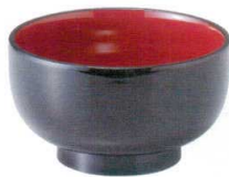
[A] 泉寿井 黒内朱 A7401-561 4.3寸 1,250円 (12.9×8.5cm・620cc) A7402-561 5寸 1,500円 (15.2×8.6cm・900cc) A7403-561 5.4寸 1,650円 (16.3×9cm・1100cc)