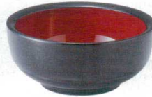
[A] 五平鉢 黒内朱天黒 A7407-561 4.5寸 1,500円 (14×6.5cm・450cc) A7408-561 5寸 1,550円 (15×6.9cm・530cc) A7409-561 5.5寸 1,900円 (16.5×7.3cm・760cc) A7410-561 6寸 2,300円 (18×8cm・1,000cc)