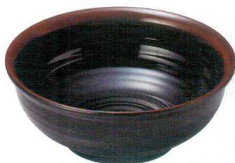
[A] 口口大鉢天目 A7438-561 8寸 3,450円 (24×10cm) A7439-561 9寸 4,000円 (27.5×11cm) A7440-561 尺0寸 4,800円 (30×12cm)