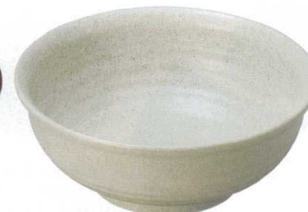
[A] 口口大鉢志野 A7441-561 8寸 4,600円 (24×10cm) A7442-561 9寸 5,250円 (27.5×11cm) A7443-561 尺0寸 6,250円 (30×12cm)