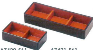
A7420-561 [A] (小) 二点珍味入れ 黒内朱 900円 (13×6.8×3.6cm)