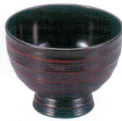
A7416-561 [A] ABS 口口目井 曙 2,300円 (13.9×10cm・700cc)