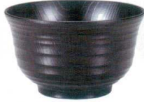
A7415-561 [PB] 4.5寸 木目お好み椀 黒 950円 (13.5×8.2cm・650cc) 洗浄機OK