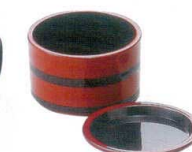
A7434-561 [A] 桶型つゆ入れ 朱に帯黒 900円 (10×6cm)