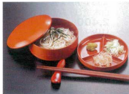
[A] 割りそば A7427-561 朱 本体 730円 (11.8×4cm) A7428-561 朱 3ッ仕切皿 650円 (11.9×1.6cm) A7429-561 朱 蓋 600円 (12.1×1.8cm)