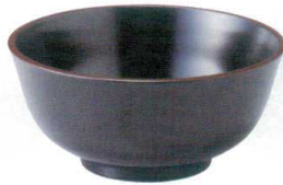
[A] 羽反型井 黒天うるみ A7404-561 5.6寸 1,400円 (17×8.5cm・890cc) A7405-561 6寸 1,850円 (18×9.1cm・1250cc) A7406-561 6.5寸 2,000円 (19.5×8.6cm・1400cc)