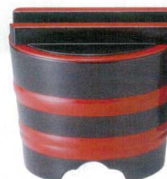
A7444-561 [A] (小) 釜揚げ 黒帯朱 浅型 5,400円 (17.6×16cm)