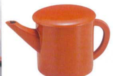
[A] ゆどう 朱 A7430-561 (小) 1,550円 (9×9.5cm・300cc) A7431-561 (大) 2,400円 (10.6×10.1cm・500cc)