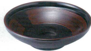
[A] 越前鉢 ハケ目一筆 A7411-561 6.5寸 2,550円 (19.5×5.8cm・800cc) A7412-561 7.5寸 3,200円 (23×6.8cm・1400cc) A7413-561 8.5寸 3,800円 (26.5×7.8cm・2000cc)