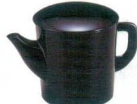
[A] ゆどう 黒 A7432-561 (小) 1,550円 (9×9.5cm・300cc) A7433-561 (大) 2,400円 (10.6×10.1cm・500cc)