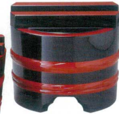
A7445-561 [A] (大) 釜揚げ 黒帯朱 14,000円 (21×19cm)