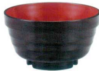
A7414-561 [TA] 14cm 口口重ね椀 黒内朱 950円 (14.2×8cm・700cc) 洗浄機OK