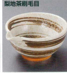
梨地茶刷毛目 11444-311 3.0片口鉢 820円 (10.3×9×4.8cm・130cc) 11445-311 3.6片口鉢 1,050円 (12.7×11.5×6.8・250cc) 11446-311 5.0片口鉢 1,850円 (16×13.5×7cm)