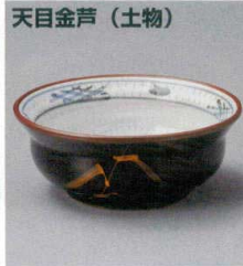
天目金芦(土物) 11406-181 瓢形4.5小鉢 2,150円 (13.2×6.6cm) 11407-181 瓢形5.0小鉢 2,450円 (15.8×6.3cm)