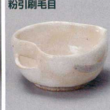
粉引刷毛目 11458-181 多用途小付 1,350円 (9.8×10.7×4.8cm) 11459-181 多用途小鉢 1,700円 (11×12×6cm)