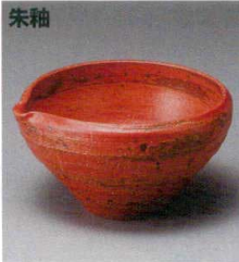
朱釉 11405-031 片口小鉢 3,000円 (12.8×11.2×6.3cm)