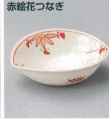
赤絵花つなぎ 11433-321 すげ傘小鉢(小) 1,250円 (10.3×9×3.3cm) 11434-321 すげ傘小鉢(大) 1,930円 (14.5×12.5×4.5cm)