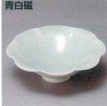
青白磁 11452-181 輪花4.0鉢 1,450円 (12.2×4.8cm) 11453-181 輪花4.8鉢 1,650円 (14.5×4.7cm)