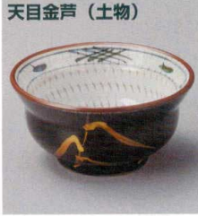
天目金芦(土物) 11438-181 瓢形干代口 950円 (8.5×3.9cm) 11439-181 瓢形3.5小鉢 1,380円 (10.4×5.1cm) 11440-181 瓢形4.0小鉢 2,050円 (11.8×5.9cm)