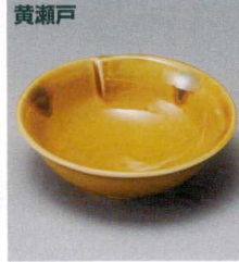
黄瀬戸 11431-121 小付 1,100円 (11×4.2cm) 11432-121 小鉢 1,900円 (13×4.8cm)