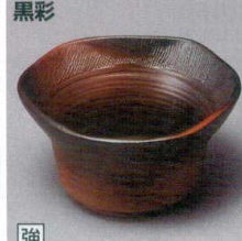
黒彩 11454-411 三方小鉢(小) 1,440円 (8.5×8×5.2cm) 11455-411 三方小鉢(中) 1,620円 (10×10×5.4cm)