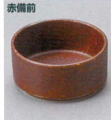
赤備前 11425-541 2.8切立鉢 770円 (8.3×3.9cm) 11426-541 3.0切立鉢 860円 (9.2×4.3cm)