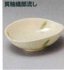
黄釉織部流し 11435-311 たわみ鉢(小) 980円 (10.8×8×4cm) 11436-311 たわみ鉢(中) 1,600円 (12.7×10×5.5cm) 11437-311 たわみ鉢(大) 2,200円 (16.8×13×6cm)