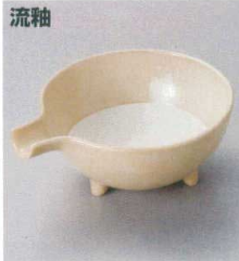
流釉 11416-461 片口薬味すり鉢(小) 1,360円 (9.5×8×4cm) 11417-461 片口薬味すり鉢(中) 1,840円 (12.5×10.7×9cm) 11418-461 片口薬味すり鉢(大) 2,915円 (15.2×12.8×6.2cm)