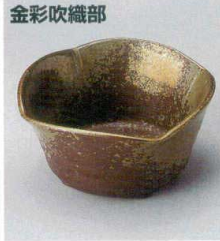
金彩吹織部 11429-131 小鉢(小) 1,750円 (9×9×5.6cm) 11430-131 小鉢(大) 1,930円 (11.2×11.2×5.8cm)