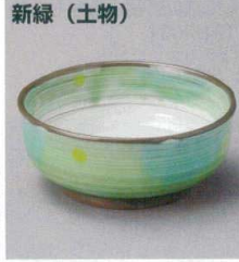
新緑(土物) 11441-181 梅型3.3并 950円 (10.5×5cm) 11442-181 梅型4.0并 1,350円 (12.7×5.3cm) 11443-181 梅型4.5并 1,900円 (14×6.8cm)