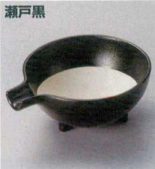
瀬戸黒 11413-461 片口薬味すり鉢(小) 1,360円 (9.5×8×4cm) 11414-461 片口薬味すり鉢(中) 1,840円 (12.5×10.7×9cm) 11415-461 片口薬味すり鉢(大) 2,950円 (15.2×12.8×6.2cm)