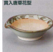
貫入唐草花型 11450-581 2.8すり小鉢 1,450円 (9.3×9×3.2cm) 11451-581 3.2すり小鉢 1,550円 (10.8×10.4×3.3cm)