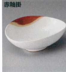
赤釉掛 11422-311 たわみ鉢(小) 950円 (10.7×8×4cm) 11423-311 たわみ鉢(中) 1,420円 (12.6×10×5.8cm) 11424-311 たわみ鉢(大) 2,140円 (16.6×13.4×5.7cm)