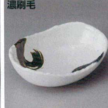
濃刷毛 11456-161 4.0楕円小鉢 1,620円 (15×11×3.5cm) 11457-161 5.0楕円小鉢 1,980円 (17×13×4.5cm)