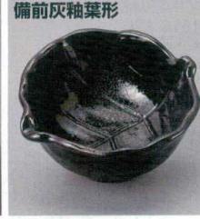
備前灰釉葉形 11447-461 小鉢(小) 1,080円 (10.5×9×5.5cm) 11448-461 小鉢(中) 1,230円 (11.5×10.5×5.8cm) 11449-461 小鉢(大) 1,320円 (13.5×12.5×6cm)