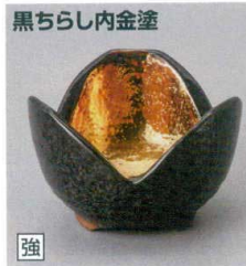
黒ちらし内金塗 11401-461 3.0三つ切形并 4,100円 (8×5cm) 11402-461 3.6三つ切形并 5,200円 (10×6.5cm)