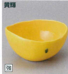
黄輝 11408-451 楕円小鉢(小) 1,390円 (10.8×10.2×5.6cm) 11409-451 楕円小鉢(大) 2,630円 (13.8×12.1×7cm)