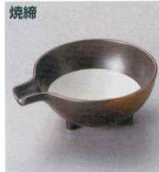
焼締 11410-461 片口薬味すり鉢(小) 1,360円 (9.5×8×4cm) 11411-461 片口薬味すり鉢(中) 1,840円 (12.5×10.7×9cm) 11412-461 片口薬味すり鉢(大) 3,000円 (15.2×12.8×6.2cm)