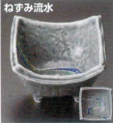
ねずみ流水 11427-461 3.0角形小鉢 2,200円 (8.5×8.5×5cm) 11428-461 4.0角形小鉢 2,600円 (11×11×5cm)