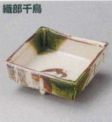
織部千鳥 11403-121 3.0四方鉢 3,150円 (9.5×9.5×4.5cm) 11404-121 4.0四方鉢 4,000円 (11.5×11.5×5cm)