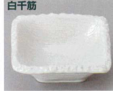
白千筋 11831-161 四角小付 1,040円 (9×9×3cm) 11832-161 四角小鉢 1,320円 (11.5×11.5×4cm)