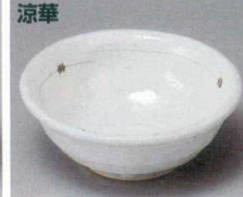
涼華 11817-321 3.5小鉢 830円 (11.3×4.5cm) 11818-321 4.5小鉢 1,200円 (14×5.5cm)