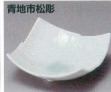
青地市松彫 11803-251 3.5鉢 1,200円 (11×6cm) 11804-251 4.5鉢 1,400円 (14×5.2cm)