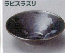
ラビラスズリ 11815-451 石目丸小鉢(小) 830円 (8.5×3cm) 11816-451 石目丸小鉢(大) 1,200円 (11×3.3cm)