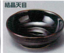
結晶天目 11809-311 3.8浅鉢 910円 (11.8×4.2cm) 11810-311 4.5浅鉢 1,220円 (13.6×4.7cm)