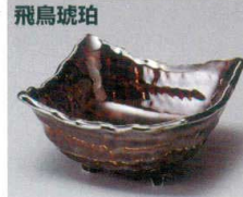
飛鳥琥珀 11811-161 3.6鉢 1,060円 (10×10×5.5cm) 11812-161 4.0鉢 1,220円 (12×12×6cm)