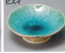
ヒスイ 11859-161 3.0高台皿 980円 (10.9×3.8cm) 11860-161 4.0高台皿 1,100円 (12.5×4.2cm)