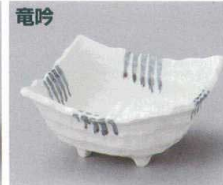
竜吟 11807-161 3.6鉢 1,060円 (10×10×5.5cm) 11808-161 4.0鉢 1,220円 (12×12×6cm)