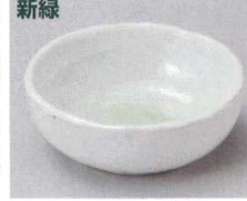
新緑 11851-321 3.5丸鉢 1,050円 (10.7×4cm) 11852-321 4.0丸鉢 1,100円 (12×4.2cm)