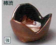
柿渋 11821-411 三ツ山小鉢・小 1,600円 (7.7×5.2cm) 11822-411 三ツ山小鉢・大 2,300円 (9.8×6.5cm)