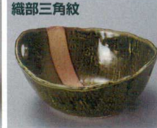
織部三角紋 11819-321 小鉢 1,280円 (12.3×10×5.2cm) 11820-321 中鉢 2,300円 (15.6×13.2×7cm)