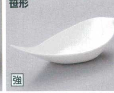
笹形 11857-09-151 小付(小) 1,000円 (15×6.2×4.3cm) 11858-151 小付(大) 1,150円 (18×7.5×5.3cm)