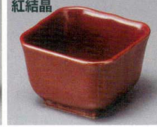
紅結晶 11845-311 角小鉢(小) 1,020円 (7.3×7.3×6cm) 11846-311 角小鉢(大) 1,180円 (9.1×9.1×6.3cm)