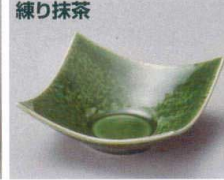
練り抹茶 11833-311 石目型角小鉢(小) 850円 (8.5×8.5×3.6cm) 11834-311 石目型角小鉢(大) 1,240円 (10×10×4.1cm)