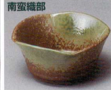
南蛮織部 11813-151 四方小鉢(小) 990円 (9×9×5.8cm) 11814-151 四方小鉢(大) 1,200円 (11.3×11.3×6cm)