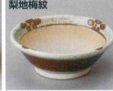
梨地梅紋 11839-581 3.2すり小鉢 1,050円 (9.8×3.5cm) 11840-581 4.0すり小鉢 1,200円 (12×4.5cm)