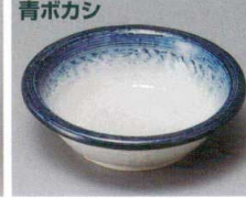
青ボカシ 11837-151 3.8鉢 830円 (11.3×4cm) 11838-151 4.5鉢 1,350円 (14×4.7cm)