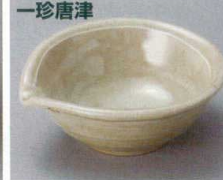
一珍唐津 11827-131 4.0片口小鉢 1,000円 (12.3×11×4.3cm) 11828-131 4.5片口鉢 1,320円 (14.8×13.3×5.2cm)