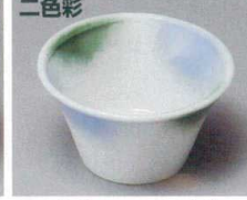
二色彩 11855-151 3.0反小鉢 800円 (8.6×5.1cm) 11856-151 3.6反小鉢 1,150円 (11.1×6.1cm)