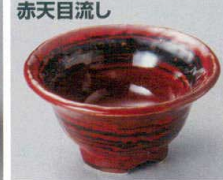
赤天目流し 11829-641 丸小鉢 小 1,100円 (10.5×5.5cm) 11830-641 丸小鉢 大 1,400円 (12.7×6.5cm)