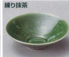
練り抹茶 11805-311 石目丸小鉢(小) 850円 (8.5×3cm) 11806-311 石目丸小鉢(大) 1,240円 (11×3.3cm)