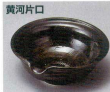
黄河片口 11801-081 3.0小付 1,000円 (9.5×4.5cm) 11802-081 4.0小鉢 1,350円 (13.5×5.2cm)