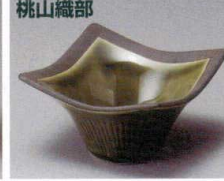
桃山織部 11843-311 花型小鉢(小) 790円 (8.2×8.2×5.6cm) 11844-311 花型小鉢(大) 1,200円 (10.8×10.8×6.5cm)