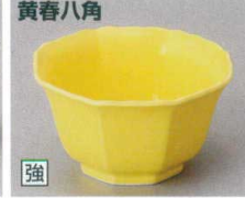
黄春八角 11835-451 小鉢(小) 790円 (8.4×4.7cm) 11836-451 小鉢(大) 1,200円 (10.2×5.6cm)