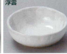
浮雲 11847-321 3.5丸鉢 1,050円 (11×4.5cm) 11848-321 4.0丸鉢 1,150円 (12×4.5cm)