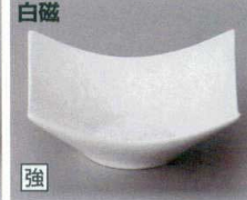
白磁 11825-291 石目型角小鉢(小) 1,000円 (8.1×3.4cm) 11826-291 石目型角小鉢(大) 1,490円 (9.7×3.8cm)