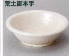
荒土御本手 11823-461 3.8小鉢 940円 (11×4cm) 11824-461 4.5小鉢 1,560円 (14×4cm)