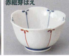
赤絵芽ばえ 11849-091 3.0小鉢 1,100円 (9.2×5.4cm) 11850-091 3.8小鉢 1,200円 (10.8×6cm)