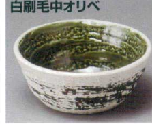
白刷毛中オリベ 11841-031 3.3小鉢 1,000円 (10.5×4.3cm) 11842-031 3.8小鉢 1,200円 (12.5×5.3cm)