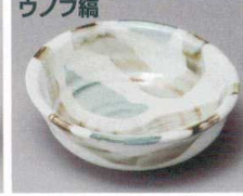
ウノフ編 11853-311 3.5小鉢 820円 (10.4×4cm) 11854-311 4.2小鉢 1,160円 (12.6×4.5cm)