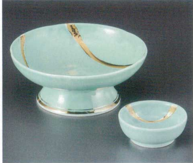
01203-221 強化雅高台向付 5,800円 (16.4×6.5cm) 01204-221 強化雅高台千代久口 1,400円 (7.8×2.9cm)