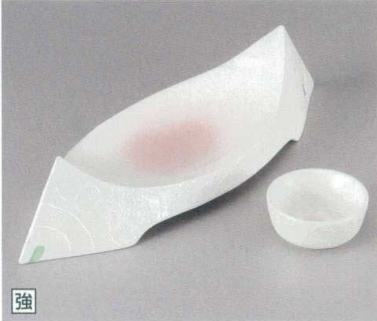
01211-181 ラスターピンク吹舟型向付 5,150円 (30.5×10.7×6.5cm) 01212-181 ラスターピンク吹丸千代口 1,180円 (6.5×2.9cm)