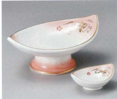
01201-331 オレンジ吹舟型高台刺身 5,500円 (21.5×13.8×8cm) 01202-331 オレンジ吹舟型千代口 1,900円 (9×6.8×3.5cm)