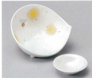
01213-471 ラスターかまくら向付 5,050円 (15.8×15.5×10cm) 01214-471 ラスター反千代口 1,250円 (8.5×2.3cm)