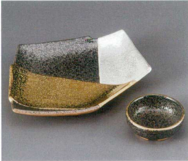
01217-451 南蛮金銀彩結び皿 5,000円 (21×15.5×3cm) 01218-451 南蛮金彩三つ足千代久 1,250円 (7×2.5cm)