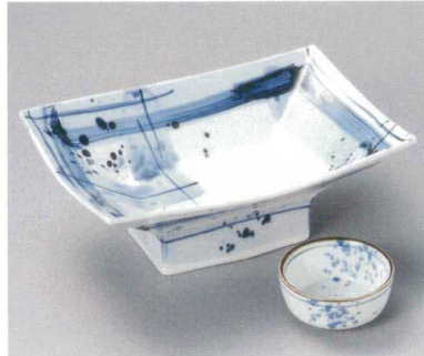
01207-461 染付呉須格子長角高台向付 5,300円 (20×14.5×8cm) 01208-461 吹墨丸千代口 1,210円 (6.5×3cm)