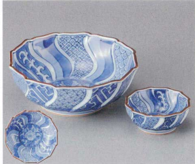
01209-181 染付捻り祥瑞刺身鉢 5,200円 (15×5.5cm) 01210-181 染付捻り祥瑞千代口 2,250円 (7.5×3.2cm)