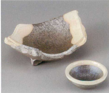
01223-431 黒窯変掛け分け変型足付皿 5,200円 (19×13×5.5cm) 01224-431 黒窯変掛け分け千代口 1,100円 (7.8×3cm)