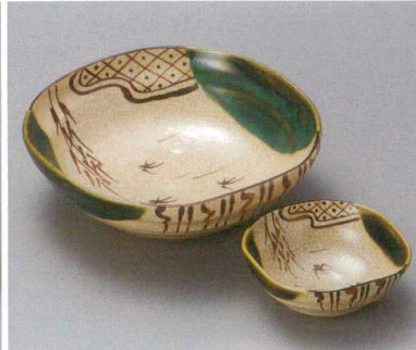
01221-451 織部つばめ四方鉢(大) 5,000円 (16.5×16.5×5.5cm) 01222-451 織部つばめ四方鉢(小) 2,200円 (9×9×3.8cm)