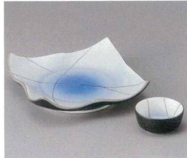
01219-301 コバルト銀彩波角皿 5,000円 (17.5×17.5×5cm) 01220-301 コバルト銀彩丸千代口(小) 1,800円 (6.7×6.7×3cm)