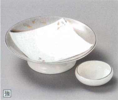
01205-531 NB 金銀彩高台向付 5,300円 (16.8×4.8cm) 01206-531 NB 測銀千代口 1,050円 (6.8×2.5cm)