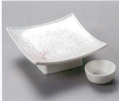
01215-471 ピンクー珍ラスター正角皿 5,000円 (17×17×5.7cm) 01216-471 ラスター丸千代口 1,300円 (6.5×3cm)