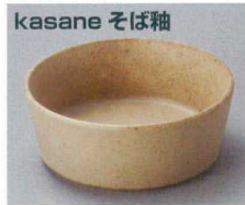
kasane そば軸 12021-081 鉢小 980円 (10×4cm) 12022-081 鉢中 1,400円 (12×4.7cm)