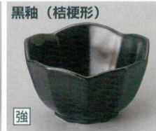
黒軸(桔梗形) 12029-461 小鉢(小) 970円 (8.5×5cm) 12030-461 小鉢(大) 1,360円 (10×5.5cm)