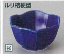
ルリ軸桔梗形 12027-091 小鉢(小) 850円 (8.3×4.9cm) 12028-091 小鉢(大) 1,150円 (10.3×5.7cm)