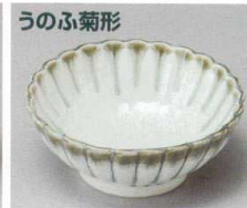
うのふ菊形 12009-151 3.0浅鉢 550円 (8.7×3.3cm) 12010-151 3.6浅鉢 790円 (11.2×4.5cm)