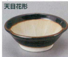
天目花形 12041-581 3.2すり小鉢 950円 (10×3.8cm) 12042-581 4.0すり小鉢 1,050円 (12×4.5cm)