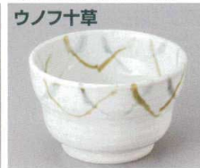
ウノフ十草 12045-191 3.0小鉢 700円 (8.5×5.3cm) 12046-191 3.5小鉢 900円 (10×6.3cm)