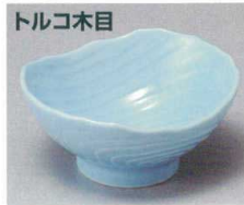
トルコ木目 12011-151 3.0鉢 550円 (8.8×8.5×5.5cm) 12012-151 4.0鉢 780円 (12×11×5.7cm)