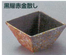
黒耀赤金散し 12031-401 角小付(小) 1,800円 (7.3×4.7cm) 12032-401 角小付(大) 2,300円 (8.2×5.1cm)