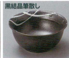
黒結晶筆散し 12047-251 3.2小鉢 850円 (9.3×5.5cm) 12048-251 3.6小鉢 980円 (11×5.2cm)