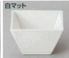
白マット 12037-581 角鉢(小) 820円 (9.6×9.6×4.8cm) 12038-581 角鉢(中) 1,000円 (11.3×11.3×6.8cm)