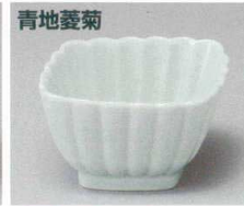
青地菱菊 12019-151 小鉢(小) 550円 (9.3×8×4.6cm) 12020-151 小鉢(大) 750円 (11.4×10×5.5cm)