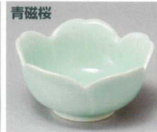
青磁桜 12007-031 小付 560円 (8.7×4cm) 12008-031 小鉢 850円 (11×5.4cm)