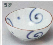
うす 12057-07-511 楕円3.5鉢 460円 (11×10.5×5.3cm) 12058-07-511 楕円4.0鉢 550円 (13.5×13×6.4cm) 12059-07-511 楕円5.0鉢 800円 (16.5×15.4×7.3cm)