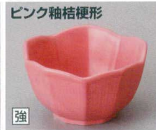
ピンク軸桔梗形 12023-461 小鉢(小) 970円 (8.5×5cm) 12024-461 小鉢(大) 1,360円 (10×5.5cm)