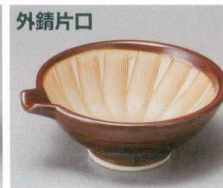
外錆片口 12060-451 すり鉢(2.8) 490円 (9.7×8.5×3.8cm) 12061-451 すり鉢(3.5) 680円 (11.8×10.5×5cm) 12062-451 すり鉢(4.0) 780円 (13.3×12×5cm)