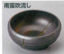
南蛮吹流し 12003-511 3.3ボール 700円 (10.5×5cm) 12004-511 4.2ボール 920円 (13×5.3cm)