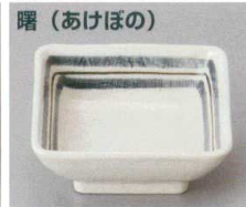
曙(あけぼの) 12035-451 3.3角千代久 850円 (8.5×3.7cm) 12036-451 4.0角小鉢 1,000円 (10.4×4cm)