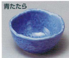
青たたら 12001-161 小付 740円 (9.8×5.1cm) 12002-161 小鉢 900円 (11.2×5.9cm)