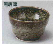
黒唐津 12005-151 3.0小鉢 670円 (8.5×5cm) 12006-151 3.5小鉢 870円 (10×6.5cm)