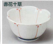
赤花十草 12017-151 3.0小鉢 600円 (9.2×5.3cm) 12018-151 3.6小鉢 760円 (10.7×6cm)