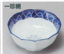
一珍網 12054-311 3.0小鉢 560円 (9.2×4.4cm) 12055-311 3.6小鉢 750円 (10.9×5.1cm) 12056-311 4.0小鉢 870円 (11.8×5cm)