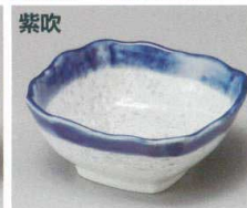
紫吹 12063-321 角3.3小鉢 440円 (8.6×8.6×4.3cm) 12064-321 角3.6小鉢 600円 (10×10×5cm) 12065-321 角4.0小鉢 700円 (11.6×11.6×5cm)