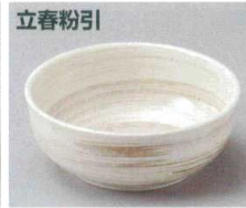
立春粉引 12015-011 六兵衛3.5小鉢 600円 (10.7×5cm) 12016-011 六兵衛4.0鉢 710円 (13×5.3cm)