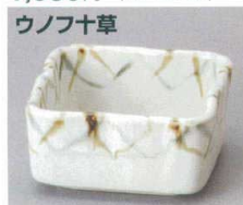
ウノフ十草 12051-191 角3.0小鉢 600円 (7.5×7.5×3.5cm) 12052-191 角3.5小鉢 800円 (9.5×9.5×4cm) 12053-191 角4.5小鉢 1,350円 (11.3×11.3×5.5cm)