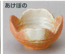
あけぼの 12049-671 六兵衛小鉢(小) 830円 (9.2×5.1cm) 12050-671 六兵衛小鉢(大) 880円 (10.3×5.6cm)