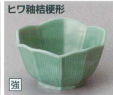
ヒワ軸桔梗形 12025-461 小鉢(小) 970円 (8.5×5cm) 12026-461 小鉢(大) 1,360円 (10×5.5cm)