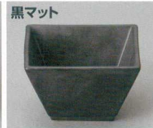
黒マット 12039-581 角鉢(小) 820円 (9.6×9.6×4.8cm) 12040-581 角鉢(中) 1,000円 (11.3×11.3×6.8cm)