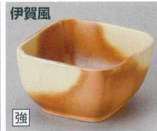
伊賀風 12033-461 3.0角形井 830円 (7×7×5cm) 12034-461 3.6角形井 1,100円 (9×9×5cm)