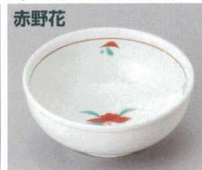
赤野花 12043-641 3.0小鉢 820円 (9.4×4cm) 12044-641 4.0小鉢 980円 (12.5×5cm)