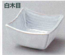
白木目 12013-19-401 角小付 530円 (8×4.7cm) 12014-401 角3.6小鉢 920円 (9.3×5.4cm)