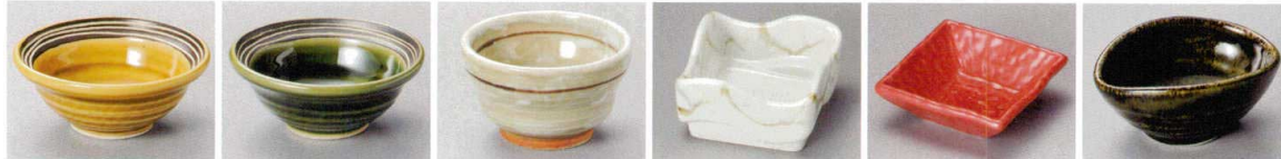
13107-451 黄瀬戸ライン3.0鉢 750円 (9.3×4cm) 13108-451 織部ライン3.0鉢 750円 (9.3×4cm) 13109-151 初雪小鉢(小) 750円 (8.6×5.1cm) 13110-191 ウノフ十草3.5波小鉢 750円 (7.8×7.8×4.3cm) 13111-491 朱正角千代口 750円 (8×8×2.8cm) 13112-251 匠織部たまご型3.0小付 750円 (10×8×4.4cm)