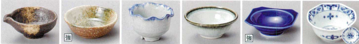
13131-331 黒釉片口珍珠 700円 (10.5×9×4.2cm) 13132-151 緑川反3.0丸井 690円 (8.7×3cm) 13133-151 コバルトフリル3.0鉢 700円 (8.9×6cm) 13134-151 うのふ流丸千代口 720円 (9.5×4cm) 13135-401 ルリ釉隅切珍珠 840円 (8.3×2.9cm) 13136-361 間取小花八角珍珠 700円 (8.5×4.5cm)