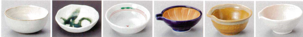
13119-30-361 京風唐津珍珠 750円 (9×9×4cm) 13120-521 白マット織部散し豆皿 750円 (9.2×2.5cm) 13121-281 錦玉丸小付 730円 (10.1×3.5cm) 13122-411 片口3.0スリ鉢ルリ 720円 (9.8×8.5×3.2cm) 13123-401 金結晶片口鉢 790円 (11.2×8.9×4.7cm) 13124-401 春がすみ片口小付 750円 (9.5×9×4.5cm)