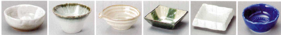
13101-091 うのふ3.0丸鉢 880円 (8.8×3cm) 13102-151 うのふ流反小付 770円 (8.5×5cm) 13103-251 萩粉引六兵衛片口小鉢 770円 (10.6×9.4×4.2cm) 13104-081 織部格子正角鉢(小) 760円 (8.5×8.5×2.5cm) 13105-671 白マット荒彫角千代口 760円 (8.1×8.1×2.6cm) 13106-301 花型珍珠ルリ 750円 (6.5×6.5×3cm)