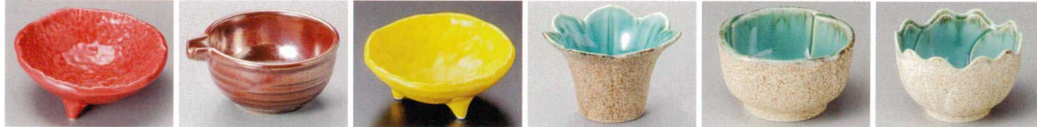
13113-491 朱岩清水三ツ足鉢 750円 (8.5×3.5cm) 13114-311 紅結晶片口小付 750円 (8.7×7.7×4cm) 13115-491 黄岩清水三ツ足 750円 (8.8×4.5cm) 13116-161 ヒスイ紅葉小付 750円 (9.3×6cm) 13117-161 ヒスイ四ツ切小付 750円 (9.2×5.4cm) 13118-161 ヒスイ桜形小付 750円 (9.1×6cm)