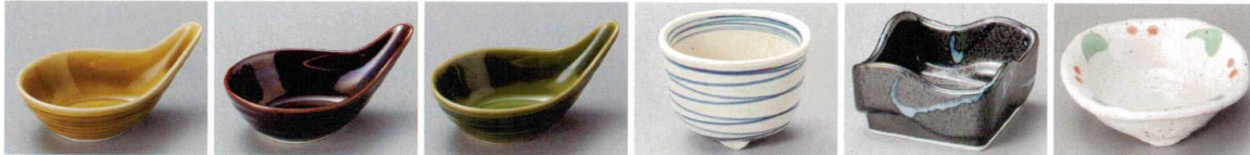
13125-311 黄瀬戸レンゲ小付 720円 (12×7.4×5.3cm) 13126-311 飴釉レンゲ小付 720円 (12×7.4×5.3cm) 13127-311 織部レンゲ小付 720円 (12×7.4×5.3cm) 13128-151 青うず三ツ足深小鉢 800円 (8.4×6.2cm) 13129-15-191 黒潮3.5スタック小鉢 720円 (7.8×7.8×3.8cm) 13130-021 桜志野三ツ足3.0小附 750円 (9.5×3.3cm)