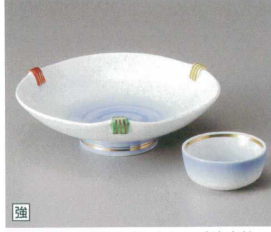
01407-071 コバルト吹三色なぶり高台向付 4,500円 (16.2×5cm) 01408-071 コバルト吹三色丸千代口 1,200円 (6.4×2.9cm)