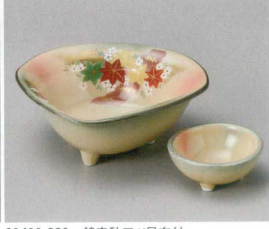
01411-221 錦春秋三ツ足向付 4,500円 (15.3×6cm) 01412-221 錦春秋千代口 1,400円 (7.4×3cm)