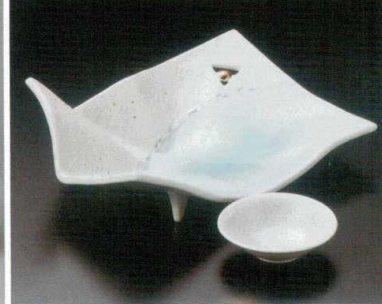
01421-471 折り紙ラスター長皿 4,400円 (23.5×17×8.5cm) 01422-471 ラスター反千代口 1,250円 (8.5×2.3cm)