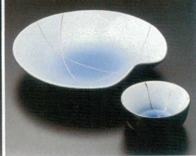
01423-531 コバルト銀彩向付 3,800円 (15.8×3cm) 01424-531 コバルト銀彩丸千代口 1,500円 (6.8×3cm)