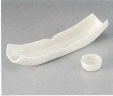
01405-281 一珍ストライプ皿型尺二前菜皿 4,500円 (38×9×8cm) 01406-281 一珍ストライプ丸千代口 1,000円 (7×3.3cm)