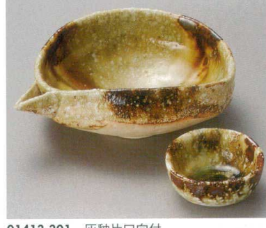
01413-301 灰釉片口向付 4,500円 (17.5×13×6cm) 01414-301 灰釉丸千代久 1,950円 (7×7×3cm)