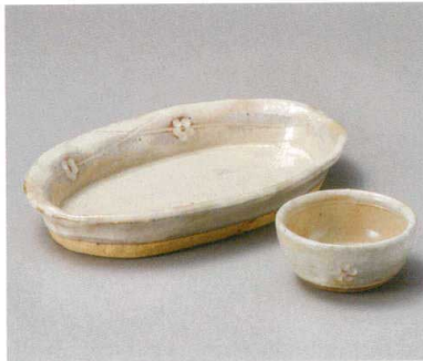
01401-181 手造り粉引華紋(土物)楕円向付 4,650円 (19×13×3cm) 01402-181 手造り粉引華紋(土物)丸千代久 1,400円 (7.2×3.5cm)