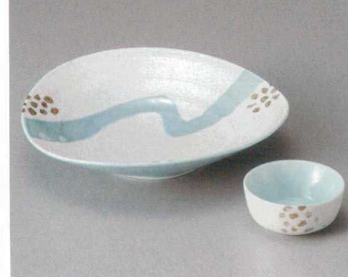
01419-011 流水ラスター6.0変形鉢 4,450円 (19×18×4.5cm) 01420-011 流水ラスター丸千代口 1,530円 (6.7×3cm)