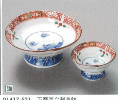
01417-521 万暦高台刺身鉢 5,300円 (15×7cm) 01418-521 万暦高台千代口 2,000円 (8.7×5cm)