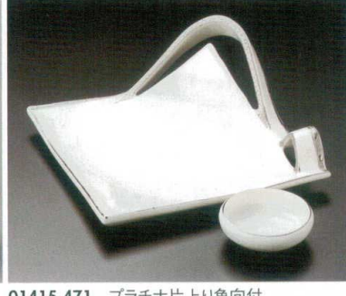
01415-471 プラチナ片上り角向付 4,500円 (18×18×8.5cm) 01416-471 測プラチナホワイト丸千代口 980円 (6.5×2.3cm)