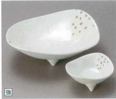
01403-131 金吹雪刺身鉢 4,450円 (18.3×14.2×5.6cm) 01404-131 金吹雪千代久 1,680円 (9.3×7.8×4cm)