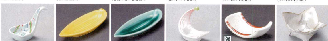
14531-181 流し十草レンゲ型珍味 1,700円 (9×6.3×7cm) 14532-651 濃黄釉笹型珍味 1,500円 (13×4.7×2.2cm) 14533-651 グリーン笹型珍味 1,500円 (13×4.7×2.2cm) 14534-181 赤筋帆かけ舟珍味 1,850円 (11×5.2×6cm) 14535-451 赤絵グリーン反り竹珍味 1,460円 (11.7×6.5×3.5cm) 14536-031 四ツ山小付 1,500円 (8×8×4.3cm)