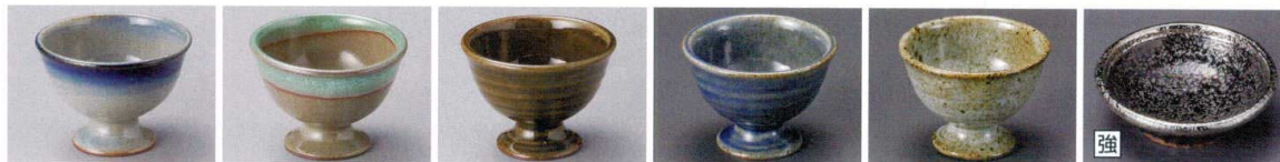
14507-581 御深井紺高台珍味 1,600円 (6.8×5.3cm) 14508-581 青均窯高台珍味 1,600円 (6.8×5.3cm) 14509-581 織部高台珍味 1,600円 (6.8×5.3cm) 14510-581 青釉高台珍味 1,600円 (6.8×5.3cm) 14511-581 唐津高台珍味 1,600円 (6.8×5.3cm) 14512-461 黒ちし口銀巻2.8丸浅鉢 1,540円 (8×2.5cm)