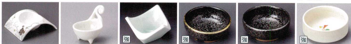
14513-521 白志野ぶどうアーチ型珍味 1,750円 (12.8×10×4cm) 14514-321 青白磁ピロ型手付珍味 1,590円 (6×3×6.5cm) 14515-471 ヒワ吹ラスター三角珍味 1,550円 (8.2×8.2×4.5cm) 14516-461 黒ちし口金三つ足丸千代口 1,540円 (7×2.5cm) 14517-461 黒ちし口銀三つ足丸千代口 1,540円 (7×2.5cm) 14518-051 赤絵みのり新丸千代口 1,600円 (6.6×2.5cm)