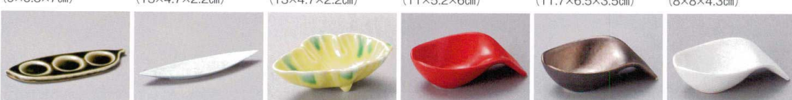
14537-201 そらまめ珍味 1,500円 (12×5×1.8cm) 14538-121 淡青磁舟形珍味 1,400円 (20.5×5.2×2cm) 14539-281 黄釉グリーン流葉型珍味 1,450円 (10.3×6.7×2.9cm) 14540-081 赤スプーン型千代口(小) 1,600円 (11.5×6.5×2.8cm) 14541-081 ブロンズスプーン型千代口(小) 1,750円 (11.5×6.5×2.8cm) 14542-081 白スプーン千代口(小) 1,500円 (11.5×6.5×2.8cm)