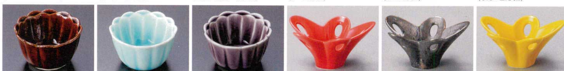
14519-471 あめ釉菊型珍味 1,650円 (6.5×3.7cm) 14520-471 青白菊型珍味 1,650円 (6.5×3.7cm) 14521-471 紫菊型珍味 1,650円 (6.5×3.7cm) 14522-301 赤透し花型珍味 1,500円 (9×9×8.2×5cm) 14523-301 金結晶透し花型珍味 1,500円 (9×9×8.2×5cm) 14524-301 黄透し花型珍味 1,500円 (9×9×8.2×5cm)