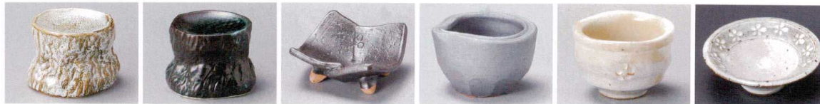
14501-101 柚子白高台珍味 1,800円 (9×6.6cm) 14502-101 紺イラホ高台珍味 1,800円 (9×6.6cm) 14503-181 黒釉トジメ珍味 1,800円 (7.8×7.2×3.6cm) 14504-181 鉄釉片口ソギ鉢 1,650円 (8×5cm) 14505-181 手造り粉引華紋(土物)珍味 1,650円 (7×5cm) 14506-471 白粉引三島反珍味 1,500円 (9.3×3.2cm) 手造り