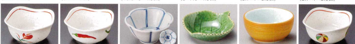
14725-341 花ひらり角珍味鉢 1,100円 (8×8×4cm) 14726-341 とうがらし角珍味鉢 1,100円 (8×8×4cm) 14727-311 割花珍味 1,100円 (7×3.8cm) 14728-251 織部大葉小付 1,200円 (8.2×7.5×2.3cm) 14729-221 茶金彩丸千代口 1,200円 (6.5×3.1cm) 14730-341 夢風船角珍味鉢 1,100円 (8×8×4cm)