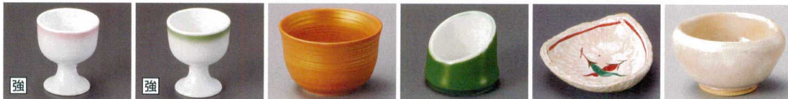
14707-461 ピンク吹高台珍味 1,210円 (4.5×5.5cm) 14708-461 グリーン吹高台珍味 1,210円 (4.5×5.5cm) 14709-401 茶金彩丸珍味 1,350円 (6.5×4cm) 14710-291 グリーン竹型珍味(小) 1,200円 (4.3×4×3.8cm) 14711-091 粉引とうがらし三角鉢(小) 1,200円 (9×2.8cm) 14712-101 粉引ククリ珍味鉢 1,300円 (7×3.7cm)