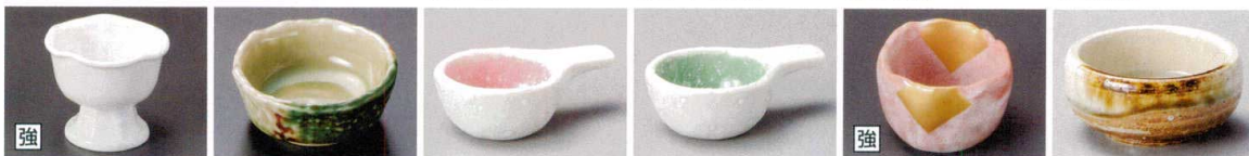
14713-291 白磁梅型高台珍味 1,200円 (6.2×5.3cm) 14714-461 織部掛(岩石)丸千代口 1,160円 (6.5×2.5cm) 14715-181 ピンク吹白ドット手付丸珍味 1,150円 (7.8×5×2.6cm) 14716-181 ヒワ吹白ドット手付丸珍味 1,150円 (7.8×5×2.6cm) 14717-291 赤楽金彩波測小付 1,150円 (6×4.2cm) 14718-051 ビードロ珍味 1,100円 (7.3×3.5cm)