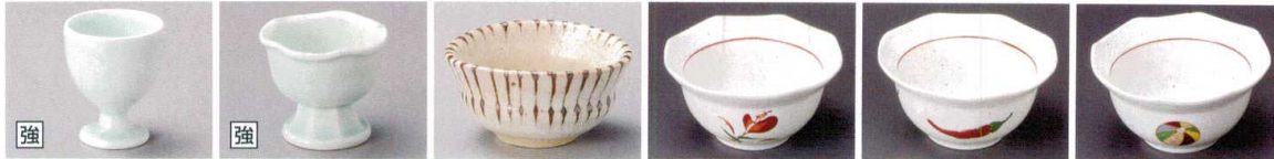
14701-411 青白磁丸型高台珍味 1,300円 (5×6.2cm・40cc) 14702-091 青白磁高台珍味 1,200円 (6.3×5.7cm) 14703-281 錆十草ひねり珍味 1,300円 (8×6.5×3.5cm) 14704-341 花ひらり八角珍味鉢 1,250円 (8.5×8.5×4.5cm) 14705-341 とうがらし八角珍味鉢 1,250円 (8.5×8.5×4.5cm) 14706-341 夢風船八角珍味鉢 1,250円 (8.5×8.5×4.5cm)