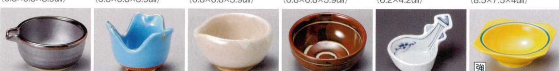
14737-411 鉄砂片口珍味 1,050円 (8.5×7.5×4cm) 14738-321 トルコ割山椒珍味 1,400円 (6.1×4.2cm) 14739-331 粉引片口珍味 1,000円 (7.3×6.7×3.8cm) 14740-581 ボーダー2.0鉢 1,000円 (7×3.2cm) 14741-651 呉須絵びわ型珍味 990円 (9×6.3×4.5cm) 14742-401 黄釉グリーン帯隅切珍味 1,080円 (8.3×2.9cm)