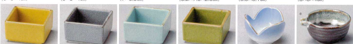
14731-081 マスタードチビ重 1,080円 (6.8×6.8×3.9cm) 14732-081 アッシュチビ重 1,080円 (6.8×6.8×3.9cm) 14733-081 ソーダチビ重 1,080円 (6.8×6.8×3.9cm) 14734-081 オリブチビ重 1,080円 (6.8×6.8×3.9cm) 14735-181 割山椒珍味コバルト 1,080円 (6.2×4.2cm) 14736-411 ブルー鉄釉片口珍味 1,050円 (8.5×7.5×4cm)