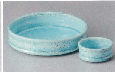
01623-031 トルコがいらぎ切立刺身鉢 3,800円 (17×3.5cm) 01624-031 トルコがいらぎ千代口 1,600円 (7×3cm)