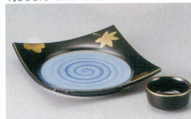
01619-181 黒釉春秋前菜皿 3,850円 (17×17cm) 01620-181 黒釉春秋丸千代口 1,250円 (6.5×3cm)