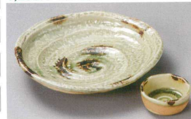
01625-461 ビードロろくべたわみ7寸皿 3,800円 (22×20.5×4cm) 01626-461 ビードロガタ彫丸千代口 1,010円 (7×3cm)