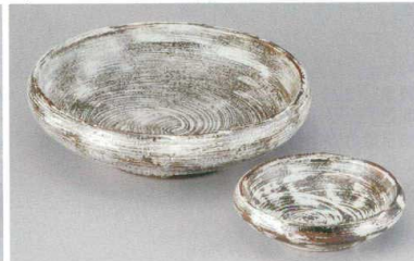
01617-101 サビ刷毛目向付 4,100円 (17.5×4.6cm) 01618-101 サビ刷毛目小皿 1,800円 (10×2.5cm)