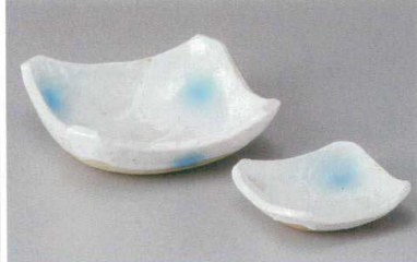
01603-411 青粉引正角刺身鉢 4,000円 (13.5×4.5cm) 01604-411 青粉引正角小皿 1,540円 (9×2cm)