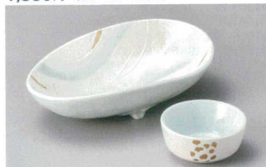
01607-011 流水ラスター楕円中鉢 4,000円 (16.8×10.7×4.8cm) 01608-011 流水ラスター千代口 1,530円 (6.7×3cm)