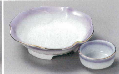
01629-471 測金紫吹花形向付 3,800円 (14.8×4.2cm) 01630-471 測金紫吹千代口 1,650円 (6.3×3.1cm)