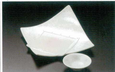
01609-471 ラスターピンク方上り皿 3,980円 (20.7×20.5×9.2cm) 01610-471 ラスター反千代口 1,250円 (8.5×2.3cm)