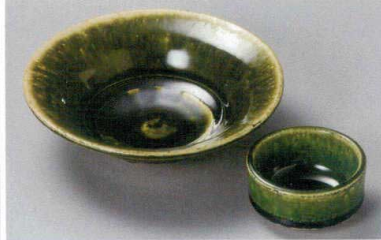
01605-471 織部丸向付 4,000円 (16.5×4cm) 01606-471 織部丸千代口 1,500円 (7×3.5cm)