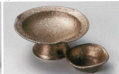
01621-471 金結晶三つ押高台向付 3,800円 (16.7×7.5cm) 01622-471 金結晶三つ足千代口 900円 (9.4×3.4cm)