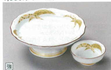
01613-291 金彩扇高台皿 3,950円 (15×5.2cm) 01614-291 金彩扇千代口 1,800円 (6.8×2.8cm)