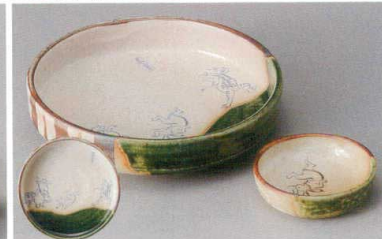
01627-101 織部鳥獸戯画5寸平鉢 4,000円 (14.8×4cm) 01628-101 織部鳥獸戯画切立千代口 2,400円 (7×1.8cm)