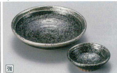
01615-461 黒ちらし測銀巻5.0丸浅鉢 4,200円 (14.5×4cm) 01616-461 黒ちらし測銀巻2.8丸浅鉢 1,540円 (8×2.5cm)