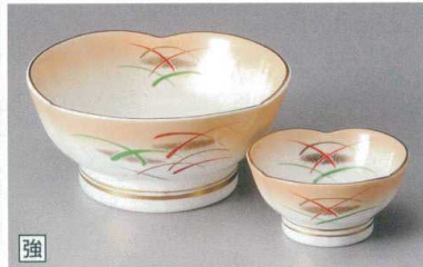
01611-081 加茂川三ツ山刺身 3,950円 (15×7cm) 01612-081 加茂川三ツ山千代口 1,600円 (8.8×4.5cm)