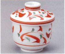
20118-471 赤絵万暦むし碗 3,700円 (7.8×8.9cm・215cc) 20119-471 赤絵万暦小むし碗 3,360円 (6.8×7.8cm・150cc)