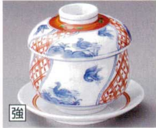
20115-16-521 万暦花鳥むし碗 3,900円 (8×8.2cm) 20116-161 万暦花鳥むし碗受皿 900円 (10.1×1.7cm)