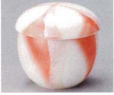
20132-531 オレンジ銀彩ネジリむし碗(小) 3,000円 (7×7cm・140cc)