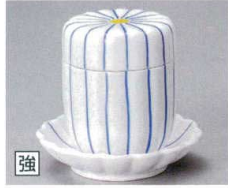
20127-451 細十草菊型むし碗 3,050円 (7×8.8cm・150cc) 20128-451 細十草受皿 1,200円 (10×2.5cm)