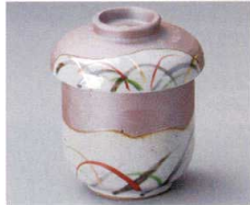
20113-121 南蛮すずきむし碗 3,300円 (8×9cm)