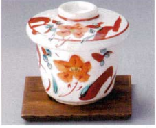
20125-451 志野赤絵むし碗 3,200円 (8.3×9.2cm) 20126-451 焼杉受皿 440円 (10×10×0.8cm)