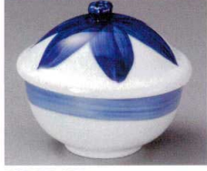
20135-051 ブルー花だえんむし碗 2,980円 (9.5×8.2×8.7cm)