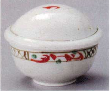
20112-471 赤絵草花姫蓋物 3,300円 (9.5×8.2×8cm・200cc)