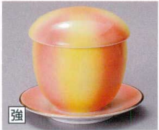
20104-651 二色吹玉蒸し碗 3,500円 (8.2×8.3cm・180cc) 20105-651 オレンジ吹受皿 1,200円 (10.5×1.5cm)