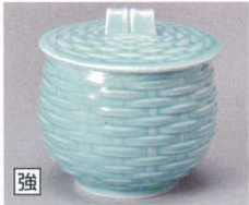
20103-291 青磁籬目蒸し碗 3,800円 (8.5×8.8cm)