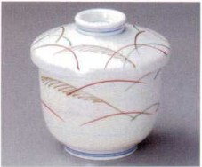
20106-121 ラスターすずき京形むし碗 3,500円 (7.5×8.5cm)