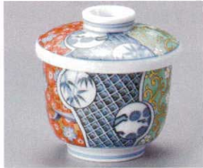
20108-531 祥瑞吉野京型むし碗 3,450円 (7.8×8.7cm・200cc)