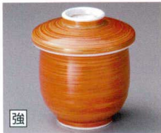
20101-331 朱巻金刷毛むし碗 3,600円 (8.3×9cm)