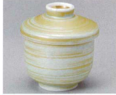
20120-471 緑巻金彩刷毛むし碗 3,600円 (7.8×8.9cm・215cc) 20121-471 緑巻金彩刷毛小むし碗 3,300円 (6.8×7.8cm・150cc)