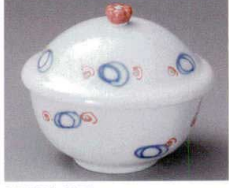
20136-051 水玉だえんむし碗 3,300円 (9.5×8.2×8.7cm)