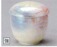
20129-021 銀彩二色ラスターむし碗 大 3,200円 (7.6×8.3cm・200cc)