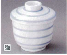
20124-121 染付駒筋京むし碗 3,200円 (7.6×8.7cm)