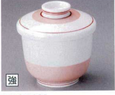
20137-281 帯むし碗 2,940円 (8.5×8.5cm)