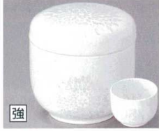
20130-161 華すかし夏目むし碗 3,040円 (8×8cm)