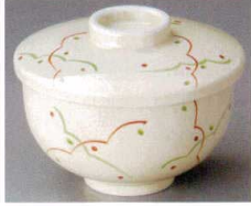
20123-051 美濃路大むし碗 3,300円 (11×9cm)