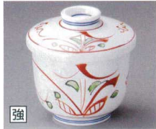
20107-081 手描き京小花京型むし碗 3,500円 (7.5×8.4cm)