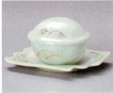
20109-471 ヒワ釉武蔵野姫蓋物 3,300円 (9.5×8.2×8cm・200cc) 20110-471 ヒワ釉武蔵野ちぎり皿 2,100円 (16×11×2cm)