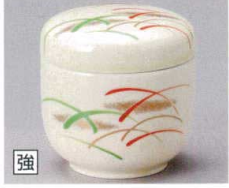
20131-531 むしの夏目むし碗 3,000円 (7.8×7.8cm・190cc)