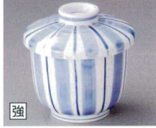
20122-231 手描太十草京型むし碗 3,200円 (7.5×8.5cm)