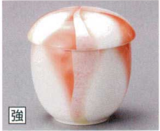
20111-531 オレンジ銀彩ネジリむし碗(大) 3,300円 (7.5×8cm・180cc)