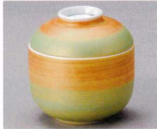
20114-541 曙金彩蒸し碗 3,800円 (7.5×8.2cm・160cc)