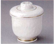
20117-181 高麗菊唐草彫むし碗 3,250円 (6.8×8.4cm)