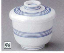
20134-281 二本線むし碗 3,000円 (8.5×8.5cm)