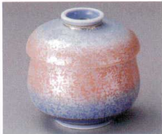
20102-331 銀彩二色吹春秋むし碗 3,600円 (8×8cm)