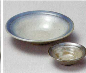
02139-121 笠間暈刺身鉢 2,600円 (17.3×4.5cm) 02140-121 笠間暈千代口 800円 (9.4×3.8cm)