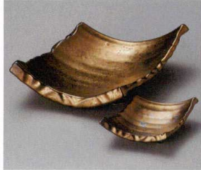
02119-101 ゴールド瓦型向付(中) 2,900円 (26.5×21×6.2cm) 02120-101 ゴールド瓦型千代口 900円 (14.2×11×3.5cm)