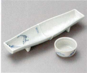
02133-101 鳥獣戯画竹割長皿 2,800円 (26×7.2×3.5cm) 02134-101 鳥獣戯画丸千代口 950円 (6.3×3.1cm)