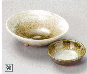
02129-191 織部かすみ片押5.0鉢 2,640円 (15×13.2×5cm) 02130-191 織部かすみ反3.0井 900円 (8.8×3cm)