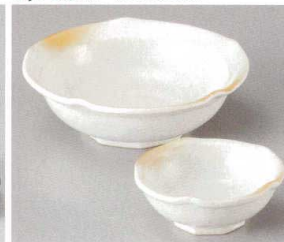
02115-121 火色志野梅形向付 2,700円 (14.9×5cm) 02116-121 火色志野梅形千代口 1,100円 (9.2×3.7cm)