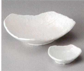
02125-281 白釉砂目大鉢 2,680円 (23×18×6.5cm) 02126-281 白釉砂目千代口 670円 (10×8.5×3cm)