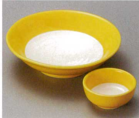
02127-321 黄白刺身鉢 2,660円 (15.8×4.3cm) 02128-321 黄白丸千代久 920円 (6.9×3.2cm)