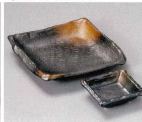
02113-461 黒備前金茶吹匠19cm正角皿 2,700円 (19×18.5×4cm) 02114-461 黒備前金茶吹匠千代口 720円 (9×9×3cm)