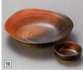
02117-321 暖橙変型6.0寸向付 2,700円 (18.7×18×4.5cm) 02118-321 暖橙丸千代口 860円 (7×2.7cm)