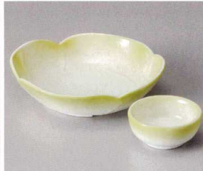
02103-321 ヒワ吹花型刺身鉢 2,760円 (15.2×14.8×4cm) 02104-321 ヒワ吹丸千代口 840円 (6.7×3cm)