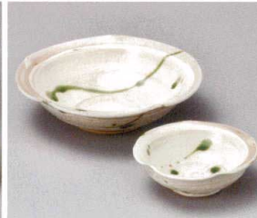
02105-121 粉引織部散し向付 2,750円 (15.5×4.5cm) 02106-121 粉引織部散し千代口 1,800円 (9.8×3.5cm)