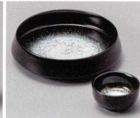
02107-541 白壁丸深向付 3,700円 (14.6×4.4cm) 02108-541 白壁丸千代久 1,100円 (6.3×3.5cm)