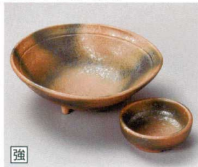
02109-461 焼締黒格子5.0片押浅鉢 2,700円 (15×13×5.5cm) 02110-461 焼締黒格子三つ足丸千代口 940円 (7×2.5cm)