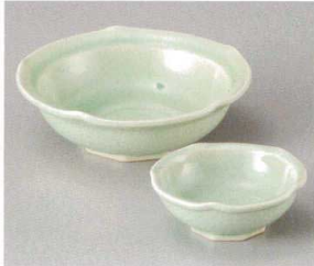
02135-121 灰釉ビードロ梅形向付 2,600円 (14.9×5cm) 02136-121 灰釉ビードロ梅形千代口 940円 (9.2×3.7cm)