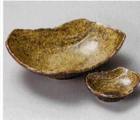
02137-461 不動荒瀬型大鉢 2,600円 (22×18×6.5cm) 02138-461 不動荒瀬型千代口 680円 (10.5×9×3cm)