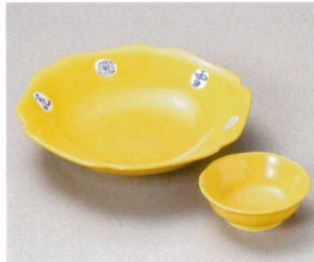
02101-471 黄釉雪月花6.0鉢 2,800円 (18.5×4.5cm) 02102-471 黄釉千代口 800円 (8.3×3.2cm)