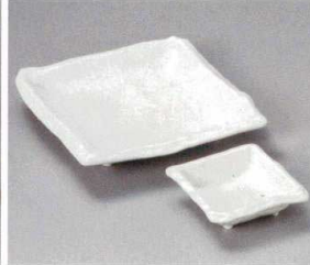
02121-461 白河 匠19cm正角皿 2,700円 (19×18.5×4cm) 02122-461 白河 匠千代口 720円 (9×9×3cm)