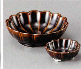
02131-311 飴カラメル菊型向付 2,620円 (15.5×4.6cm) 02132-311 飴カラメル菊型千代口 830円 (8.2×3.2cm)