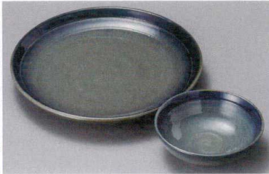
21003-121 笠間壺8.0天皿 3,300円 (24.8×3.5cm) 21004-121 笠間壺7.0丸皿 2,500円 (21.5×3cm) 21005-121 笠間壺丸玉割 1,200円 (13×4.3cm)