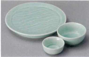
21006-01-521 深海青磁6.3寸皿 2,700円 (19×2.3cm) 21007-01-521 深海青磁吞水 1,050円 (8.9×4cm) 21008-011 深海青磁丸千代口 760円 (6.6×3cm)