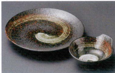
21018-651 白刷毛窯7.0皿 1,900円 (22.3×3.4cm) 21019-651 白刷毛窯6.0皿 1,300円 (19.2×2.8cm) 21020-651 白刷毛窯吞水 950円 (12.7×12×5cm)