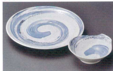
21029-641 粉引青流7.0天皿 950円 (22.3×3cm) 21030-641 粉引青流吞水 400円 (13×12.2×4.3cm)