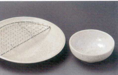
21033-641 雪路6.0皿 750円 (19.2×3cm) 21034-641 雪路半月金網(小) 1,200円 (17×8.5×0.5cm)