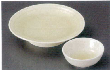
21001-181 黄白磁6.0高台皿 3,800円 (18.7×4cm) 21002-181 黄白磁とん水 2,000円 (10×4cm)