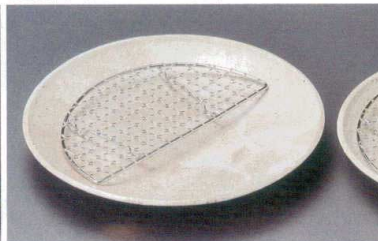
21031-641 雪路7.0皿 900円 (22.6×3.2cm) 21032-641 雪路半月金網(大) 1,200円 (18.7×9×0.5cm)