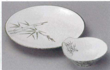
21027-051 グリン竹7.0皿 1,300円 (22.5×3cm) 21028-051 グリン竹吞水 550円 (12.7×4.5cm)