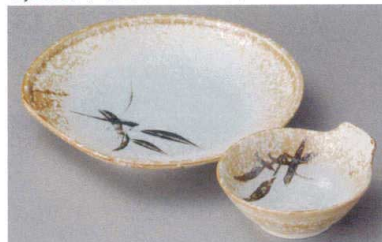
21015-331 石焼芦7.5天皿 1,900円 (23×21.5×3.5cm) 21016-331 石焼芦6.5天皿 1,300円 (20×19.5×2.8cm) 21017-331 石焼芦吞水 1,000円 (13×12×5.5cm)