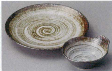
21021-331 白刷毛均窯7.0天皿 1,900円 (22.7×3cm) 21022-331 白刷毛均窯吞水 1,000円 (12.7×12×5.2cm)