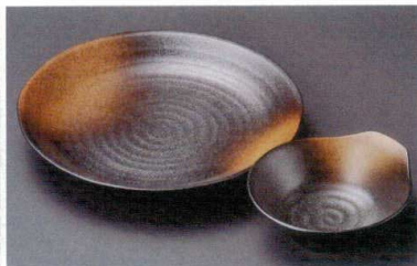
21025-641 金茶吹京7.0皿 1,300円 (22×3.5cm) 21026-641 金茶吹新吞水 630円 (13×12.2×4.5cm)