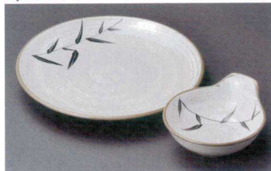
21009-021 白刷毛笹7.0天皿 2,400円 (21.5×2.8cm) 21010-021 白刷毛笹吞水 1,050円 (12.6×11.5×4cm)