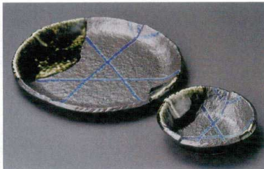
21011-451 南蛮乱十草7.0丸皿 2,190円 (22×2.2cm) 21012-451 南蛮乱十草吞水 1,240円 (12×2.8cm)