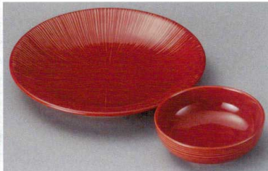
21013-161 千段朱7.5皿 2,070円 (23.7×3.4cm) 21014-161 千段朱4.0ボール 1,100円 (13×4.5cm)