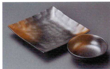
21023-511 金茶吹正角皿(大) 1,900円 (18.4×18.4×2.7cm) 21024-511 金茶吹3.8ボール 600円 (11.7×3.9cm)