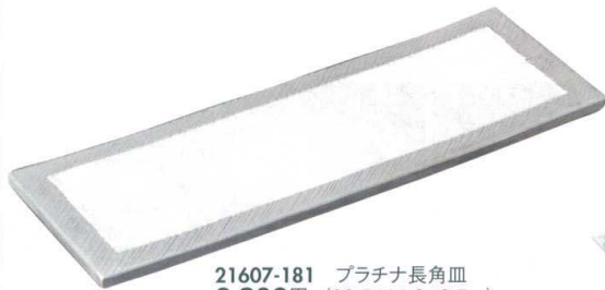
21607-181 プラチナ長角皿 6,800円 (32.5×11.3×2.5cm)