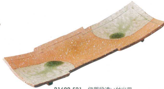
21602-521 伊賀段違い付出皿 9,000円 (35×11.5×4.2cm) 手造り