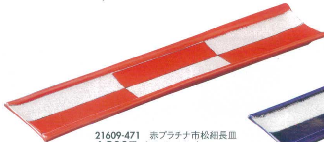
21609-471 赤プラチナ市松細長皿 4,800円 (40×7×1.5cm)