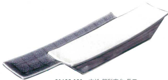
21605-181 市松 銀彩高台 長皿 5,950円 (36×9×4.3cm)