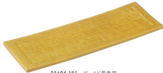
21604-181 ゴールド長角皿 6,400円 (32.5×11.3×2.5cm)