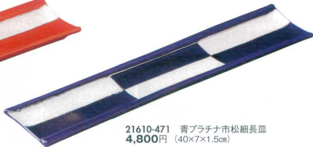
21610-471 青プラチナ市松細長皿 4,800円 (40×7×1.5cm)