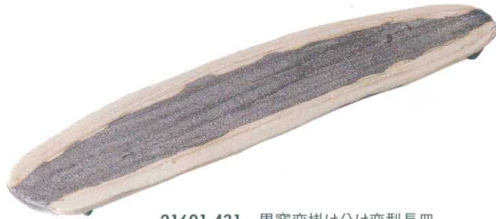
21601-431 黒窯変掛け分け変型長皿 11,000円 (39×10×2.3cm)