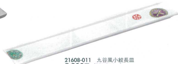
21608-011 九谷風小紋長皿 5,800円 (39×6×1cm)