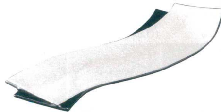
21606-651 銀彩重ね長皿 5,100円 (29×9.8×3.8cm)