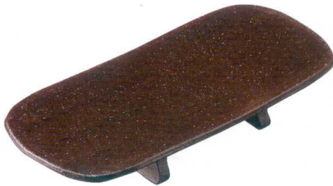
21603-651 渋釉まな板皿 6,850円 (31×14.5×5cm)