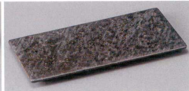
22613-471 金結晶石肌23.5長角皿 2,150円 (23.5×11×1.2cm)