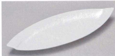
22604-161 オビ21cm長皿 1,500円 (21.3×8×2.2cm)