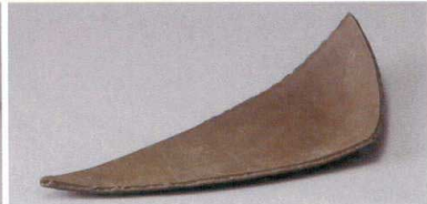
22610-541 黒陶三角長皿 2,700円 (34.5×13cm)