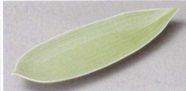
22606-121 グリーン笹形9.5前菜皿 2,200円 (30×10×3cm)