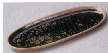
22617-331 油滴天目楕円皿大 2,100円 (23×13.5×3.5cm)