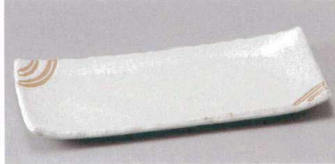
22602-191 粉引木目さんま皿 2,200円 (28.5×12.3×2.8cm)