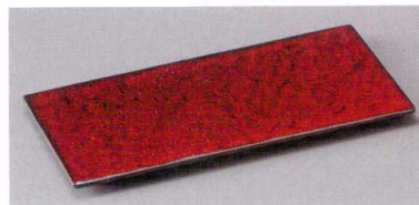
22611-471 紅柚子天目石肌23.5長角皿 2,150円 (23.5×11×1.2cm)