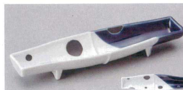
22614-521 塗分け水玉突出し 2,200円 (26×7×3.7cm)