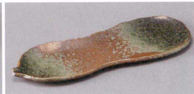
22616-131 金彩吹織部瓢型付出皿 2,100円 (24×8.7×1.2cm)