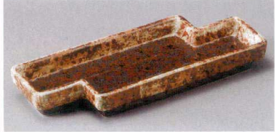
22603-471 黒伊賀かいらぎ八つ橋付出皿 2,200円 (24.5×9.2×3.7cm)