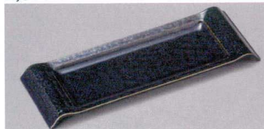
22608-451 ラピスラズリ石目9.0プレート 2,300円 (28.2×10×1.8cm)