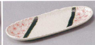
22619-091 織部花散しトレーM 2,100円 (27.5×11cm)