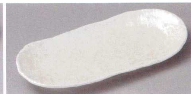
22618-031 黄磁岩清水付出皿 2,100円 (24.2×11×2.4cm)