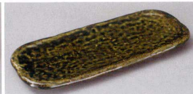
22612-251 匠織部パレット突出皿 2,300円 (29×11.9×2.1cm)