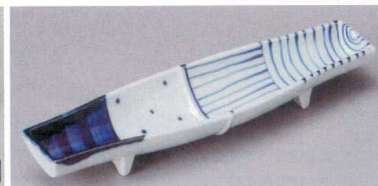
22615-181 染付間取竹割長皿 2,200円 (26×7.3×3.5cm)