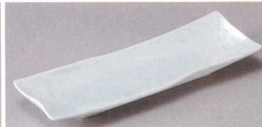
22609-491 青白磁長角皿(細)(イルタ) 2,400円 (25.2×8.5×3cm)