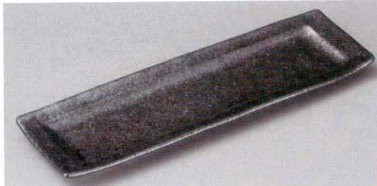
22601-071 黒銀彩付出物 2,250円 (27.8×8.9×2.8cm)