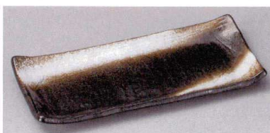
22717-311 白吹黒中鮎皿 2,000円 (22.8×10.2×2.3cm)