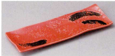
22704-101 祝付出皿 2,400円 (28.5×9.5×2cm)