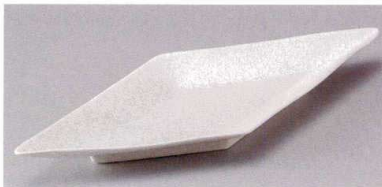
22710-541 ラスター(白)菱型皿 2,600円 (30.3×11.5×3.5cm)