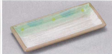
22702-181 新緑(土物)長角付出皿 2,100円 (22×9.8×1.8cm)