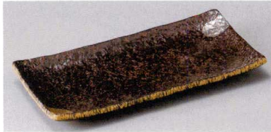
22701-091 南蛮金銀彩突出皿(小) 2,100円 (23.5×11×2.7cm)