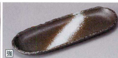
22709-131 白吹黒水晶10.0楕円長皿 2,050円 (30.3×11×2.4cm)