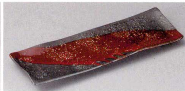
22705-101 朱流し付出皿 2,400円 (28.5×9.5×2cm)