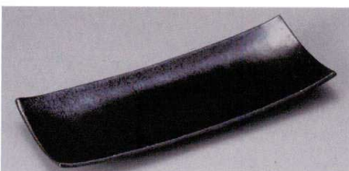
22716-331 黒付出皿 2,050円 (27.5×10.5×3.5cm)