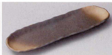
22708-07-461 黒釉前菜皿 2,050円 (27.4×8.2×2.2cm)