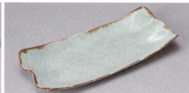
22706-221 波草釉松葉盛皿 2,000円 (28×12.5×7.5cm)