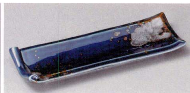
22712-121 ルリサビ吹付出皿 2,000円 (25×9.7×3cm)