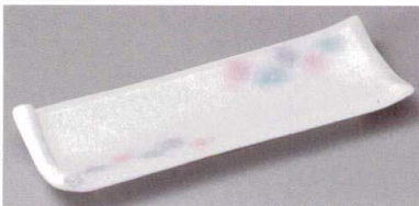
22713-181 淡雪 三色吹突出皿 1,800円 (25.5×9×3cm)