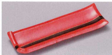
22711-181 紅柚子 黒帯突出皿 2,350円 (25.5×9×3cm)