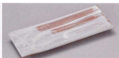
22718-181 銀志野芦(土物)長角付出皿 2,050円 (23.5×9.3cm)