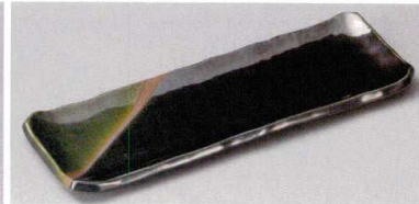
22703-411 黒半掛オリベ細長角付出皿 2,100円 (23×7.5cm)