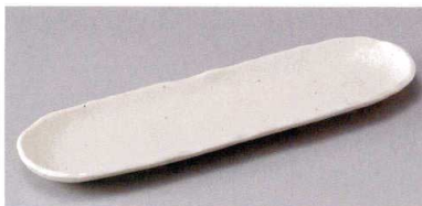
22707-461 粉引釉長丸皿(小) 2,050円 (27.5×8×2cm)