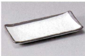
23510-341 桃山(石目)7.0付出皿 1,100円 (22×10.2×2.5cm)