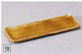
23513-061 黄海付出皿 1,090円 (23×7.7×1.5cm)