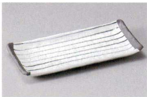
23509-341 いぶし黒黒十草長角付出皿 1,100円 (21.8×10×2.5cm)