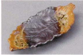
23502-481 南蛮一珍木ノ葉付出皿 1,300円 (26×11×3cm)