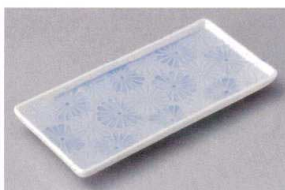
23523-311 菊紋付出皿 830円 (21.2×9.4×2.5cm)