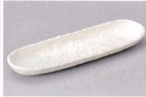
23503-511 結晶マットレー 1,100円 (30.4×9.7×3cm)