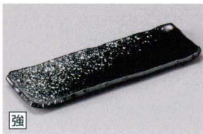
23514-061 雪雷付出皿 1,130円 (23×7.7×1.5cm)