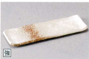
23521-061 白藤改付出皿 1,030円 (23×7.7×1.5cm)