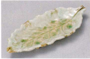
23501-481 砂ビードロ木ノ葉付出皿 1,300円 (26×11×3cm)