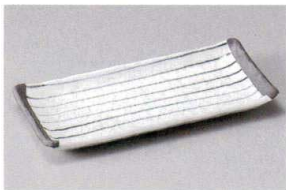
23509-341 いぶし黒十草長角付出皿 1,100円 (21.8×10×2.5cm)