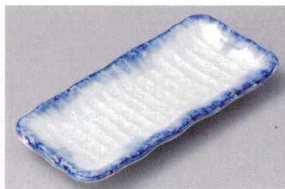
23515-011 呉須刷毛目付出皿 1,050円 (22×10×2cm)