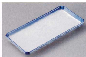
23525-311 内呉須波付出皿 770円 (20.4×9×2.4cm)