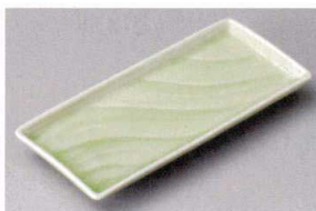
23519-151 ヒワ貫入付出皿 1,100円 (20.8×9.5×2.6cm)