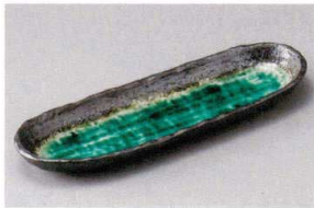
23505-511 深海トレー 1,080円 (30×9.7×3cm)