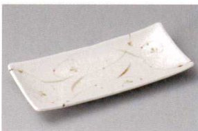
23517-151 サビ唐草付出皿 1,150円 (22.5×10.1×2.7cm)