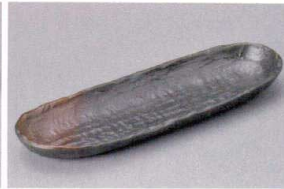
23504-511 黒備前風トレー 1,100円 (30.4×9.7×3cm)