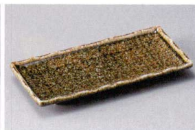
23512-671 みの唐津付出皿 1,050円 (22×10.5×2.6cm)