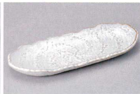
23508-711 白うず8.5長皿 1,200円 (26.5×11.2×2.5cm)