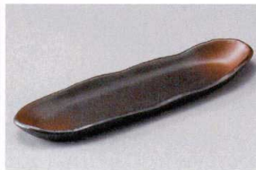
23507-601 備前吹付出皿 1,050円 (27.8×7.8×2.5cm)