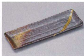
23516-241 吹き流し付出皿 1,050円 (25.8×8.7×1.7cm)