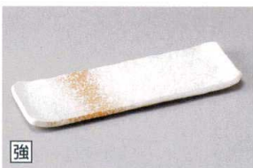
23522-061 白藤付出皿 1,030円 (23×7.7×1.5cm)