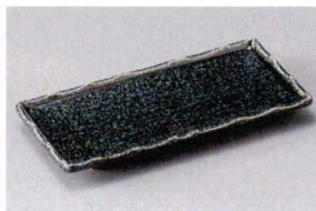
23511-671 あい唐津付出皿 1,050円 (22×10.5×2.6cm)