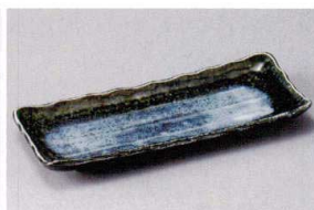
23520-341 おぼろ月付出皿 1,000円 (22.5×9.3×2.5cm)