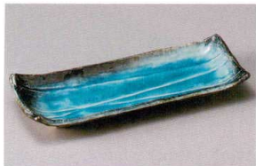
23713-541 黒流しブルーソギ突出皿 700円 (20.2×8×3.5cm)