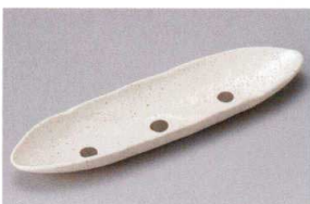
23724-301 白ドット(中)楕円鉢 640円 (25.5×6.7×3cm)