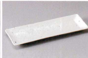
23703-511 白粉引長角皿 880円 (27.7×10.2×2cm)