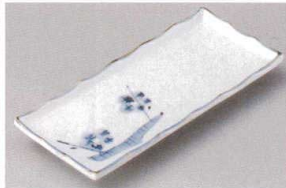
23702-331 青地布目梅7.0付出皿 950円 (20.5×9×2cm)