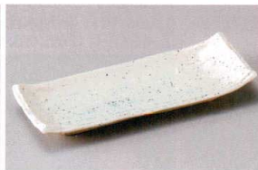
23707-541 三彩貫入ソギ突出皿 700円 (20.2×8×3.5cm)