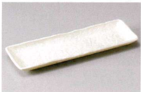
23718-541 クリームソギ突出皿 690円 (26×8.5×2.2cm)