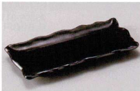
23710-541 黒ケズリ7.5長皿 700円 (22.4×10.5×2.3cm)