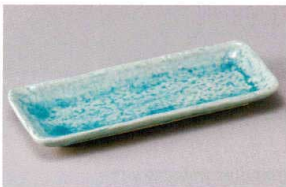
23714-571 トルコ釉付出皿 730円 (21.5×8.4×2.5cm)