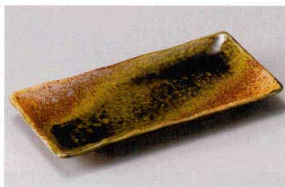
23715-521 石焼織部お好み皿 650円 (19.5×9.5×2.8cm)