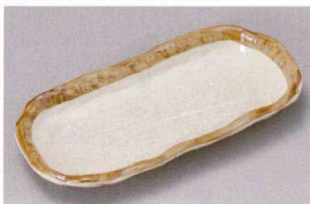
23720-181 結晶粉引深口前菜皿 630円 (22.5×11.5×3cm)