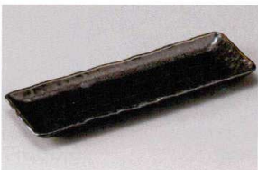
23719-541 黒長角ソギ突出皿 690円 (26×8.5×2.2cm)