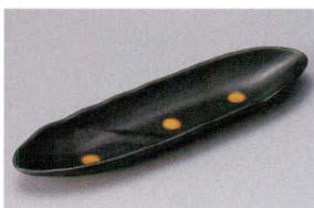
23725-301 黒ドット(中)楕円鉢 640円 (25.5×6.7×3cm)