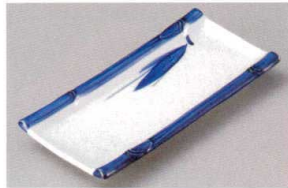
23701-311 紺竹測箸付出皿 830円 (21×9.8×2.8cm)