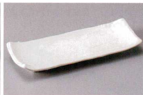
23708-541 白マットソギ突出皿 700円 (20.2×8×3.5cm)