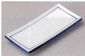
23706-151 測コスライン付出皿 800円 (20.7×9.3×2.3cm)