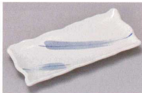
23711-181 そよ風前菜皿 630円 (22×11×2.8cm)