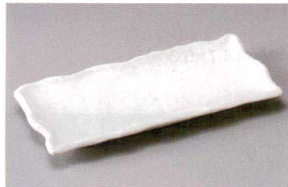
23709-541 白ケズリ7.5長皿 700円 (22.4×10.5×2.3cm)