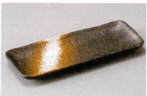
23722-571 黒備前付出皿(小) 730円 (21.5×8.5×2cm)