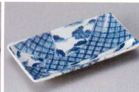
23704-541 染付山水のり皿 760円 (18×10×2.5cm)