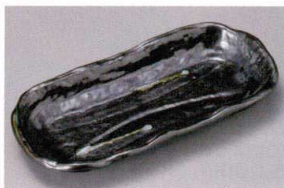
23721-181 浮雲深口前菜皿 630円 (22.5×11.5×3cm)