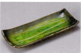
23723-541 藍染ヒワソギ突出皿 660円 (20.2×8×3.5cm)