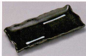
23712-181 白流し前菜皿 630円 (22×11×2.8cm)