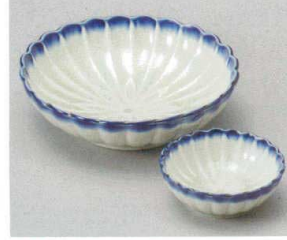
02633-541 藍流花型5.0鉢 2,100円 (16.7×5cm) 02634-541 藍流花型3.0鉢 980円 (9×3.5cm)