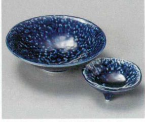
02639-641 藍紺岩清水向付 1,350円 (14.8×4.4cm) 02640-641 藍紺岩清水千代久 750円 (8.6×3.3cm)