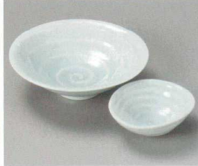
02611-341 青白磁うず潮向付 1,500円 (15.2×4.7cm) 02612-341 青白磁うず潮千代口 800円 (9.3×8.5×3.2cm)