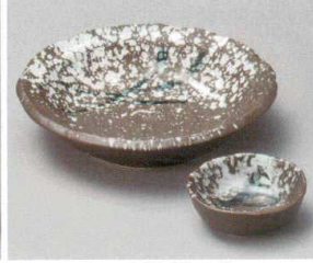
02627-301 雪化粧6.0鉢 1,450円 (19×19×5cm) 02628-301 雪化粧小付 530円 (8.5×8.5×3.2cm)