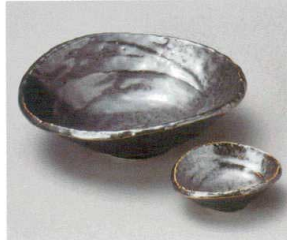
02601-251 鉄結晶扇中鉢 1,560円 (17.5×16.5×5.4cm) 02602-251 鉄結晶扇千代口 720円 (8.4×7.3×3.1cm)