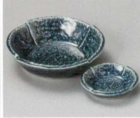
02619-131 紺釉5.0刺身鉢 1,490円 (15×3.8cm) 02620-131 紺釉丸千代口 480円 (8.5×1.8cm)