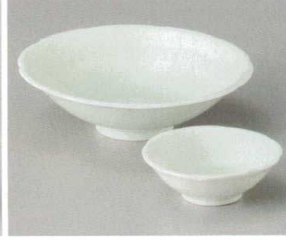
02635-25-491 もえぎ輪花向付 1,400円 (15×15×4cm) 02636-25-491 もえぎ千代口 500円 (8.5×3cm)