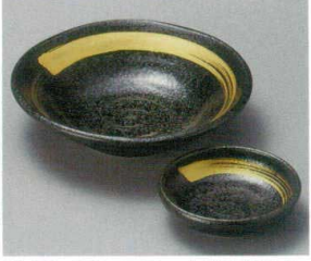
02631-401 天目一本刷毛刺身鉢 1,400円 (14.7×3.8cm) 02632-401 天目一本刷毛千代口 820円 (8.3×2.3cm)