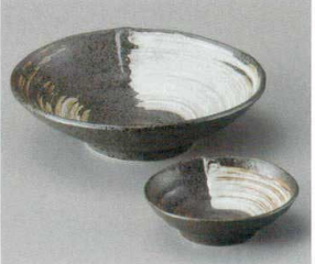
02607-011 豪快・白翔中鉢 1,750円 (17.3×15.8×6.2cm) 02608-011 豪快・白翔千代口 800円 (9.8×8.6×3.3cm)