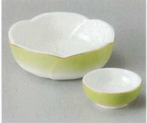
02605-311 梅型グリーン刺身鉢 1,530円 (14.3×4.6cm) 02606-311 梅型グリーン丸千代口 830円 (7.5×2.8cm)