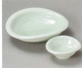
02609-341 もえぎたわみ向付 1,500円 (17.3×15×4.5cm) 02610-341 もえぎたわみ千代口 800円 (9.2×8.3×3.5cm)