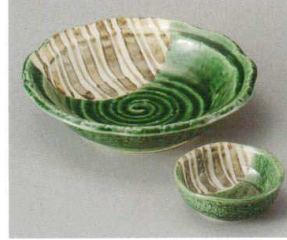
02625-301 織部千段向付 1,450円 (19×19×5cm) 02626-301 織部千段千代口 530円 (8.5×8.5×3.2cm)