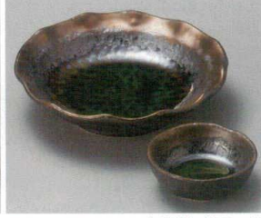
02637-051 いぶし金彩織部花型5.0鉢 1,500円 (17×4.3cm) 02638-051 いぶし金彩織部丸千代口 640円 (8.2×3cm)