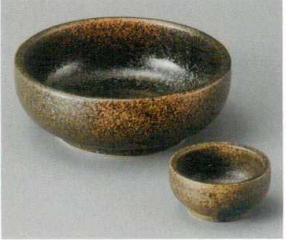
02615-071 緑天目丸向付 1,500円 (15.7×5.8cm) 02616-071 緑天目丸千代口 430円 (6.9×3.5cm)