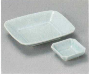
02613-541 青白磁 間取型長角皿 1,500円 (15.5×13×3cm) 02614-541 青白磁 角千代久 800円 (6.5×6.5×2.3cm)