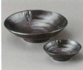
02603-251 鉄結晶翔大鉢 1,560円 (17.5×16×5.2cm) 02604-251 鉄結晶翔千代口 720円 (8×7.4×2cm)