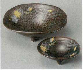
02623-161 春秋三ツ足向付 1,470円 (15.2×4.5cm) 02624-161 春秋三ツ足千代口 760円 (9.9×2.8cm)