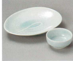
02617-541 青磁とじめ向付 1,600円 (19.5×15×3cm) 02618-541 青白磁丸千代久 940円 (7.5×3.2cm)