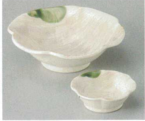
02621-051 粉引織部向付 1,480円 (15.2×4.5cm) 02622-051 粉引織部千代口 600円 (8×2.5cm)