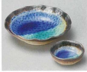
02629-301 二色貫入刺身井 1,450円 (17×17×4.3cm) 02630-301 二色貫入丸千代口 530円 (8.2×8.2×3cm)