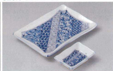
26026-411 祥瑞花長角8.0皿 3,300円 (20.5×14.5cm) 26027-411 祥瑞花長角小皿 1,400円 (10×7cm)