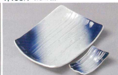
26035-311 蒼空木目長角皿 2,520円 (23.2×17.6×3cm) 26036-311 蒼空木目千代口 700円 (10.8×6×3cm)