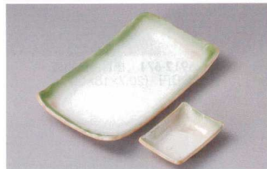
26014-411 粉引グリーン吹長角8.0皿 3,800円 (23.2×14.5×2cm) 26015-411 粉引グリーン吹長角7.0皿 2,100円 (19.5×12.8×1.8cm) 26016-411 粉引グリーン吹長角小皿 1,000円 (9.5×7×2cm)