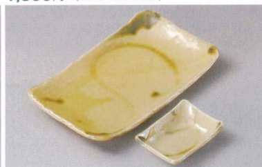
26023-411 キゼト手描長角8.0皿 3,200円 (23×14cm) 26024-411 キゼト手描長角7.0皿 2,200円 (19×12.5cm) 26025-411 キゼト手描長角小皿 1,100円 (9×7cm)