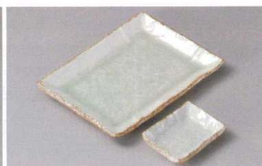
26031-151 貴入若草9.0長角皿 2,700円 (26.5×15.9×2.5cm) 26032-151 貴入若草8.0長角皿 2,000円 (21.5×16.2×2cm) 26033-151 貴入若草7.0長角皿 1,700円 (20.3×14.4×2cm) 26034-151 貴入若草角千代口 530円 (9.7×7.5×2cm)