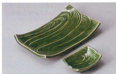
26021-311 練り抹茶流水型8.0長角皿 3,300円 (21.2×13×4.3cm) 26022-311 練り抹茶流水型長角小皿 750円 (9.4×7.3×3.2cm)