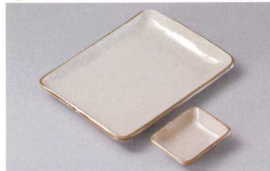
26007-411 益子風長角9.0皿 4,100円 (17×22.5×2.5cm) 26008-411 益子風長角8.0皿 3,500円 (13.5×22.5×2cm) 26009-411 益子風長角小皿 800円 (7×9×2.5cm)