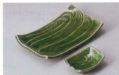
26021-311 練り抹茶流水型8.0長角皿 3,300円 (21.2×13×4.3cm) 26022-311 練り抹茶流水型長角小皿 750円 (9.4×7.3×3.2cm)