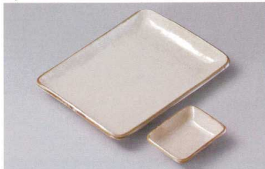
26007-411 益子風長角9.0皿 4,100円 (17×22.5×2.5cm) 26008-411 益子風長角8.0皿 3,500円 (13.5×22.5×2cm) 26009-411 益子風長角小皿 800円 (7×9×2.5cm)