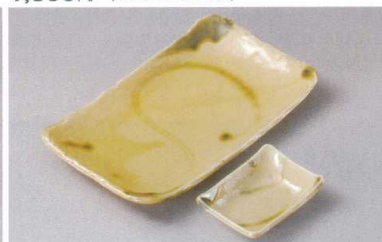
26023-411 キゼト手描長角8.0皿 3,200円 (23×14cm) 26024-411 キゼト手描長角7.0皿 2,200円 (19×12.5cm) 26025-411 キゼト手描長角小皿 1,100円 (9×7cm)