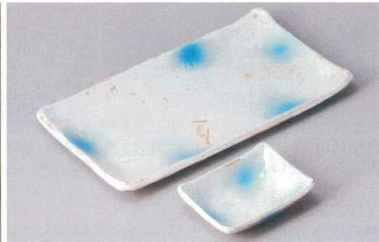
26012-411 青粉引長角9.0皿 4,000円 (24.5×14cm) 26013-411 青粉引長角小皿 1,600円 (9.5×7cm)