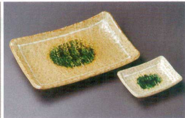
26019-191 古都の香8.0長角皿 3,460円 (22.3×15.2×4cm) 26020-191 古都の香角千代口 820円 (10.5×8×3cm)