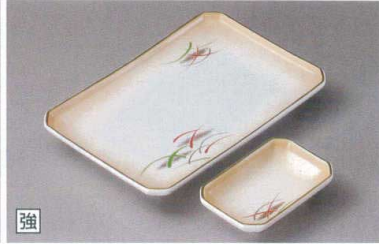
26005-081 加茂川四ツ切7.0焼物皿 4,200円 (19×11.8×2.7cm) 26006-081 加茂川四ツ切千代口 1,700円 (10.8×6.8×2.7cm)