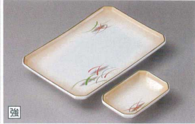
26005-081 加茂川四ツ切7.0焼物皿 4,200円 (19×11.8×2.7cm) 26006-081 加茂川四ツ切千代口 1,700円 (10.8×6.8×2.7cm)