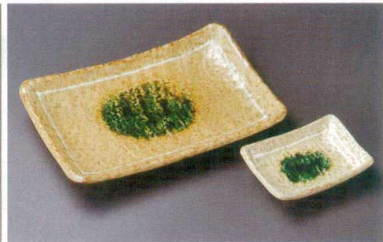
26019-191 古都の香8.0長角皿 3,460円 (22.3×15.2×4cm) 26020-191 古都の香角千代口 820円 (10.5×8×3cm)