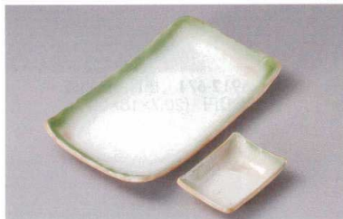
26014-411 粉引グリーン吹長角8.0皿 3,800円 (23.2×14.5×2cm) 26015-411 粉引グリーン吹長角7.0皿 2,100円 (19.5×12.8×1.8cm) 26016-411 粉引グリーン吹長角小皿 1,000円 (9.5×7×2cm)