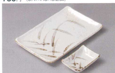
26028-411 紅志野長角8.0皿 2,850円 (22×14.5×2cm) 26029-411 紅志野長角7.0皿 1,860円 (20.5×13×1.5cm) 26030-411 紅志野長角小皿 720円 (9.2×6.5×2.6cm)