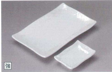
26001-411 パール長角焼物皿 4,800円 (22×14cm) 26002-411 パール長角小皿 1,550円 (10×7cm)