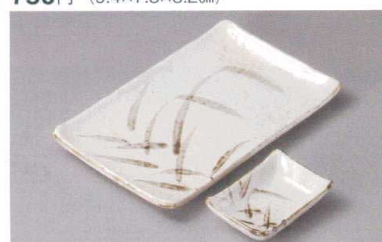
26028-411 紅志野長角8.0皿 2,850円 (22×14.5×2cm) 26029-411 紅志野長角7.0皿 1,860円 (20.5×13×1.5cm) 26030-411 紅志野長角小皿 720円 (9.2×6.5×2.6cm)