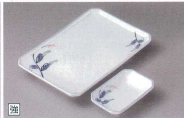
26017-231 やまと四ツ切焼物皿 3,500円 (21.5×14.4×2.8cm) 26018-231 やまと長角千代口 1,300円 (10.5×7×2.7cm)