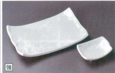
26010-291 白磁流水型8.0寸長角皿 4,600円 (20.4×12.3×3.7cm) 26011-291 白磁流水型長角小皿 1,050円 (9.1×7.1×3cm)