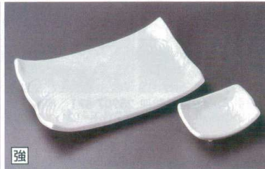
26010-291 白磁流水型8.0寸長角皿 4,600円 (20.4×12.3×3.7cm) 26011-291 白磁流水型長角小皿 1,050円 (9.1×7.1×3cm)