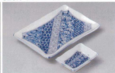
26026-411 祥瑞花長角8.0皿 3,300円 (20.5×14.5cm) 26027-411 祥瑞花長角小皿 1,400円 (10×7cm)