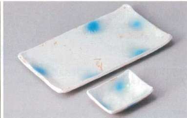
26012-411 青粉引長角9.0皿 4,000円 (24.5×14cm) 26013-411 青粉引長角小皿 1,600円 (9.5×7cm)