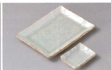
26031-151 貴入若草9.0長角皿 2,700円 (26.5×15.9×2.5cm) 26032-151 貴入若草8.0長角皿 2,000円 (21.5×16.2×2cm) 26033-151 貴入若草7.0長角皿 1,700円 (20.3×14.4×2cm) 26034-151 貴入若草角千代口 530円 (9.7×7.5×2cm)