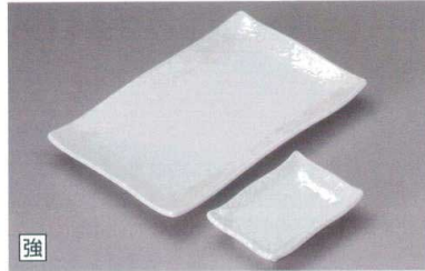
26001-411 パール長角焼物皿 4,800円 (22×14cm) 26002-411 パール長角小皿 1,550円 (10×7cm)