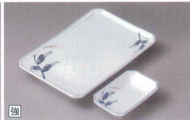
26017-231 やまと四ツ切焼物皿 3,500円 (21.5×14.4×2.8cm) 26018-231 やまと長角千代口 1,300円 (10.5×7×2.7cm)