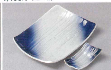
26035-311 蒼空木目長角皿 2,520円 (23.2×17.6×3cm) 26036-311 蒼空木目千代口 700円 (10.8×6×3cm)