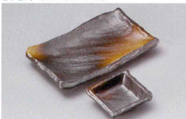
26130-101 黒備前匠長角皿 2,600円 (22.5×14×H3.5cm) 26131-101 黒備前匠千代口 800円 (9.5×9×H3cm)