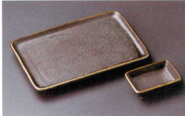
26101-641 いぶし金焼物皿 2,800円 (22.5×14.5×2.5cm) 26102-641 いぶし金角千代久 1,100円 (9×6×3cm)