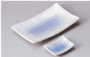
26113-151 瑠璃ウノフ8.0長角皿 2,300円 (23.8×14.5×3.7cm) 26114-151 瑠璃ウノフ7.0長角皿 2,100円 (20.5×13.4×3.6cm) 26115-151 瑠璃ウノフ6.0長角皿 1,760円 (18.4×11.5×3.5cm) 26116-151 瑠璃ウノフ長角小皿 680円 (9.3×6.9×2.7cm)