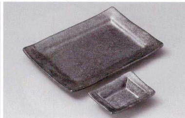
26111-071 黒銀彩焼物皿 2,400円 (19.3×13.6×2.3cm) 26112-071 黒銀彩角千代口 1,150円 (8.7×6.5×2.3cm)