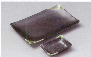
26132-411 オリベ黒マット長角7.0皿 2,200円 (20×13cm) 26133-411 オリベ黒マット長角小皿 720円 (9×6.3cm)