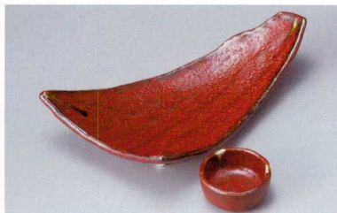
26126-011 紅柚子天目9.5三角皿 3,500円 (28.3×6.5cm) 26127-011 紅柚子天目千代口 920円 (6.5×3cm)