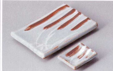
26105-181 銀志野芦(土物)長角7.5皿 2,450円 (21×14cm) 26106-181 銀志野芦(土物)長角千代口 720円 (8.5×6.5×2.8cm)