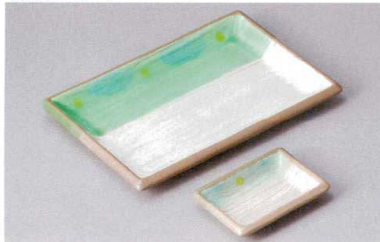
26107-181 新緑(土物)長角焼物 2,500円 (21.5×14.8×1.8cm) 26108-181 新緑(土物)長角千代口 900円 (9.3×6.5×1.8cm)