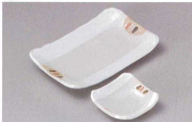
26117-411 粉引赤入長角7.0皿 2,300円 (20×13×1.5cm) 26118-411 粉引赤入正角小皿 1,200円 (8.8×8.8×2cm)