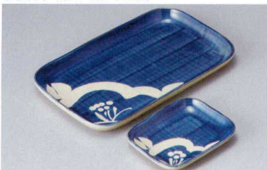
26128-311 片椿ナデ角長角焼物皿 1,550円 (23×14.2×2cm) 26129-311 片椿ナデ角長角小皿 990円 (10.8×8.8×1.5cm)