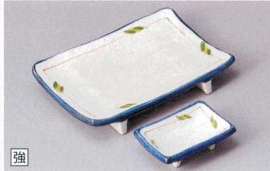
26103-161 たんざく紋焼物皿 2,500円 (21.5×14.5×3cm) 26104-161 たんざく紋長千代口 880円 (9.8×6.7×3cm)