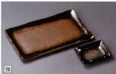
26124-061 舞妓8.0焼物皿 1,910円 (23.3×14.3×1.7cm) 26125-061 舞妓長角千代口 570円 (9.3×6.6×2.1cm)