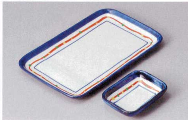
26109-321 新珠(あらたま)8.0長角皿 2,800円 (21×13.5cm) 26110-321 新珠(あらたま)長角小皿 1,050円 (8.8×6.5cm)