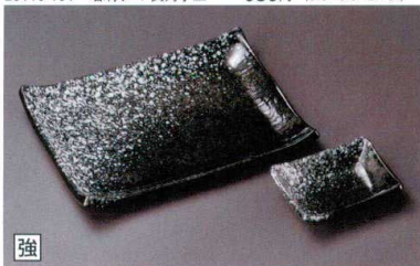
26122-061 雪雷8.5焼物皿 2,110円 (21.3×15.6×2.7cm) 26123-061 雪雷長角千代口 580円 (9.2×6.8×2.1cm)