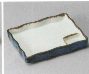
27818-281 瀏サビ長角仕切皿(大) 1,800円 (18×14×3cm)