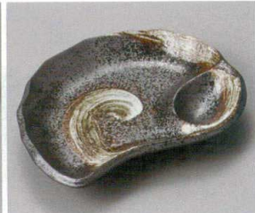
27812-671 白刷毛貝型仕切皿 2,000円 (21.5×17×3.7cm)