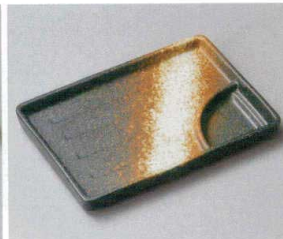
27815-461 いぶし備前7.0仕切付長角皿 1,850円 (19.5×13×2cm)