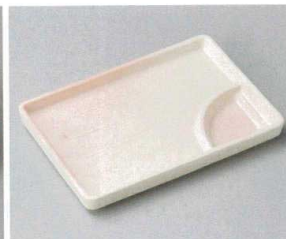
27814-461 桜志野7.0仕切付長角皿 1,850円 (19.5×13×2cm)