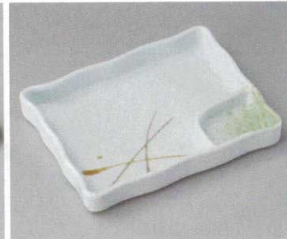
27816-051 美濃路仕切皿(大) 1,850円 (17.5×14×2.4cm)