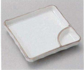
27804-091 淡彩ライン正角仕切皿 2,650円 (16.7×16.7×3cm)