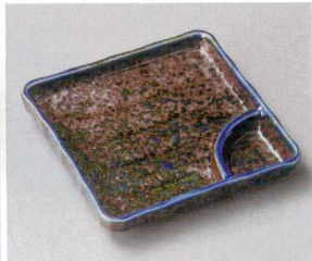
27808-291 いろり正角仕切り皿 2,500円 (16.8×16.8×2.8cm)