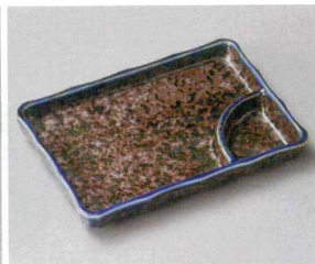
27810-291 いろり7.0長角仕切皿 2,350円 (19×13×2.5cm)