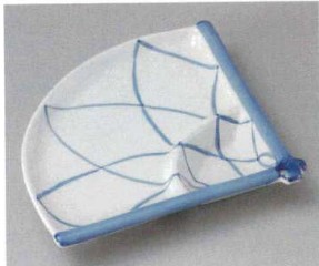
27801-411 アミ絵扇面仕切皿 3,000円 (16.5×2.5cm)