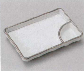
27803-091 淡彩ライン7.0仕切皿 2,650円 (19×13.2×2.5cm)