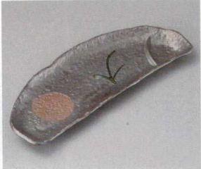
27802-051 月あかり仕切長多用皿 2,650円 (31.3×12cm)