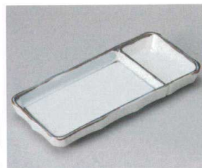
27809-151 淡彩ライン付出仕切皿 2,150円 (20.5×9.3×2.5cm)