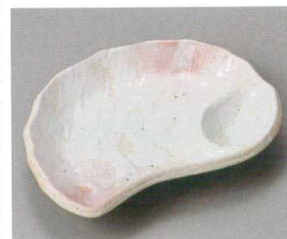
27813-671 桜志野貝型仕切皿 2,000円 (21.5×17×3.7cm)