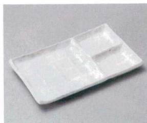
27805-091 うのふ仕切皿 2,200円 (23.8×14.5×2.2cm)