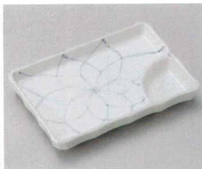
27806-091 手描網7.0仕切皿 2,650円 (19×13.2×2.5cm)