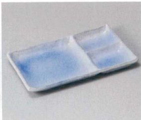
27807-151 瑠璃ウノ7.0長角三品皿 2,300円 (23.8×14.4×2.3cm)