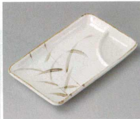
27811-411 紅志野アジ7.0長角仕切皿 2,000円 (20.3×12.5×2cm)