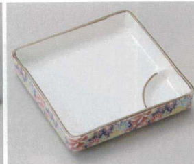
27819-671 藍花舞正角仕切皿 1,650円 (16.5×16.5×3.5cm)