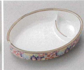
27820-671 藍花舞小判型仕切り鉢 1,650円 (19×14×4cm)