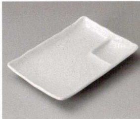
27901-201 白砂仕切皿 1,600円 (17.1×11.8×2.4cm)