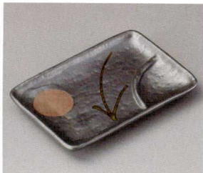
27904-051 月あかり6.0仕切皿 1,450円 (17.5×12cm)