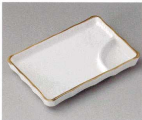
27906-251 茶淵5.5長角仕切皿 1,540円 (14×10.8×1.8cm)