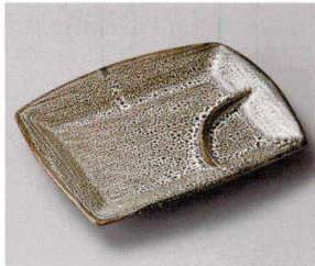
27902-541 白柚子天目仕切皿 1,700円 (18×13.5×3cm)