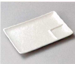
27919-461 白砂仕切皿(小) 1,210円 (17×12×2.5cm)