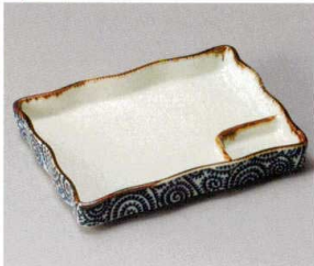
27912-251 タコ唐草長角仕切皿大 1,600円 (18.1×14.3×2.9cm)