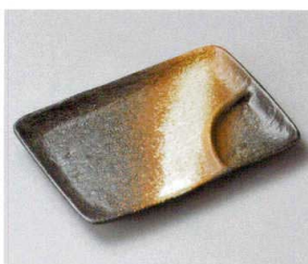
27918-571 黒備前7寸仕切り皿 1,300円 (21.5×14.5×2.5cm)