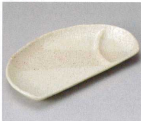
27914-401 白化粧塗分半月仕切皿 1,400円 (23.5×12.5×3cm)