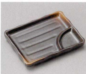
27915-461 焼締5.5長角仕切皿 1,290円 (14×11×2cm)