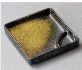
27923-641 伊賀天目仕切皿(大) 1,200円 (16.5×16.5×3cm)