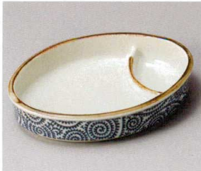
27911-25-671 タコ唐草小判仕切皿 1,350円 (18.9×14×3.9cm)