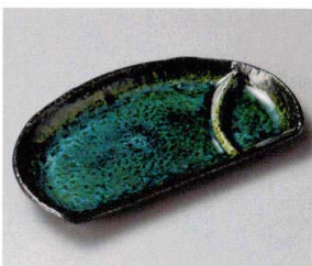
27916-021 ゆず黒銀河半月仕切皿 1,250円 (23.8×12.8×2.7cm)