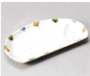
27917-181 三彩 半月仕切皿 1,240円 (24×13×3cm)