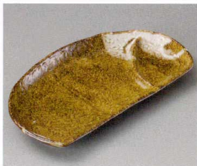
27908-401 黄河流半月仕切付皿 1,400円 (24×13×2.8cm)