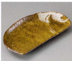
27908-401 黄河流半月仕切付皿 1,400円 (24×13×2.8cm)