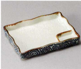
27912-251 タコ唐草長角仕切皿大 1,600円 (18.1×14.3×2.9cm)