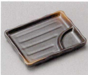
27915-461 焼締5.5長角仕切皿 1,290円 (14×11×2cm)