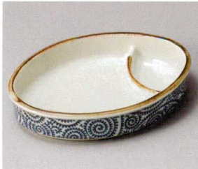
27911-25-671 タコ唐草小判仕切皿 1,350円 (18.9×14×3.9cm)