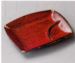
27903-541 紅柚子天目仕切皿 1,700円 (18×13.5×3cm)