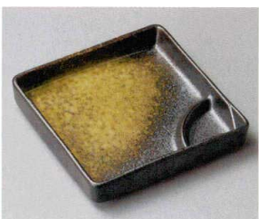
27923-641 伊賀天目仕切皿(大) 1,200円 (16.5×16.5×3cm)