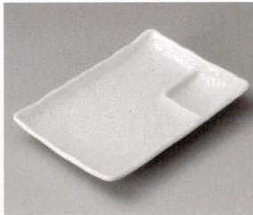
27901-201 白砂仕切皿 1,600円 (17.1×11.8×2.4cm)