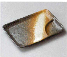
27918-571 黒備前7寸仕切り皿 1,300円 (21.5×14.5×2.5cm)