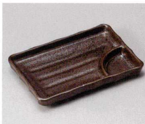
27905-321 鉄線花7.0長角仕切皿 1,650円 (18.5×12.9×2.3cm)