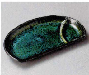
27916-021 ゆず黒銀河半月仕切皿 1,250円 (23.8×12.8×2.7cm)