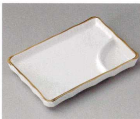
27906-251 茶淵5.5長角仕切皿 1,540円 (14×10.8×1.8cm)