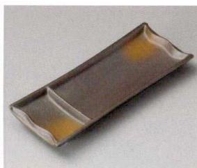
27909-071 備前竹割刺身皿(小) 1,020円 (21.3×9.3×2.7cm)