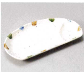
27917-181 三彩 半月仕切皿 1,240円 (24×13×3cm)