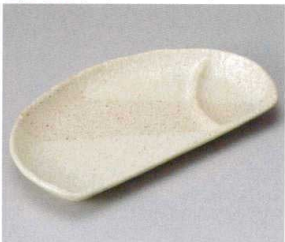
27914-401 白化粧塗分半月仕切皿 1,400円 (23.5×12.5×3cm)