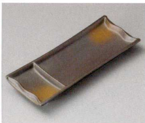
27909-071 備前竹割刺身皿(小) 1,020円 (21.3×9.3×2.7cm)