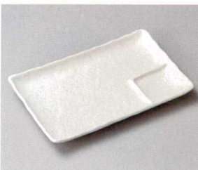
27919-461 白砂仕切皿(小) 1,210円 (17×12×2.5cm) 27920-461 白砂仕切皿(大) 1,540円 (22.5×14×2.5cm)