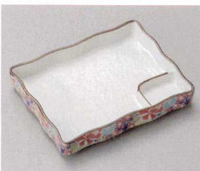
27921-671 藍花舞長角仕切皿小 1,250円 (15×12×3.1cm) 27922-671 藍花舞長角仕切皿大 1,620円 (18×14×3cm)