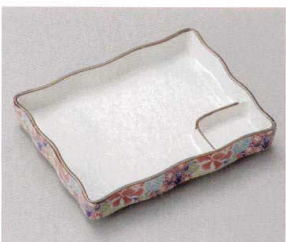
27921-671 藍花舞長角仕切皿小 1,250円 (15×12×3.1cm)