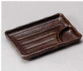
27905-321 鉄線花7.0長角仕切皿 1,650円 (18.5×12.9×2.3cm)