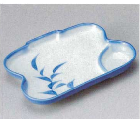
27924-021 笹ひさご仕切皿 1,200円 (22×15×3cm)