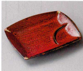
27903-541 紅柚子天目仕切皿 1,700円 (18×13.5×3cm)