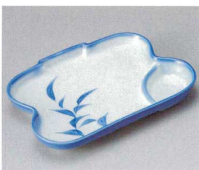
27924-021 笹ひさご仕切皿 1,200円 (22×15×3cm)