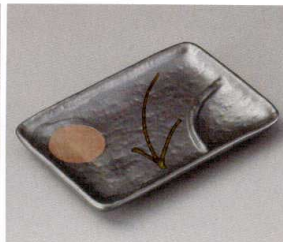
27904-051 月あかり6.0仕切皿 1,450円 (17.5×12cm)