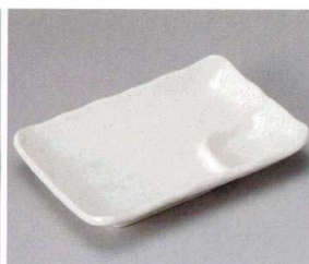
28115-181 粉引6.0仕切皿 650円 (16.8×11.2×2.8cm)