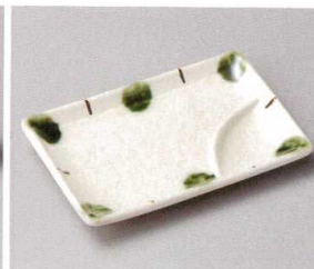
28104-191 オリベ瀬十草6.0仕切皿 700円 (17.3×11.3×2.2cm)