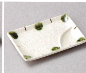
28104-191 オリベ瀬十草6.0仕切皿 700円 (17.3×11.3×2.2cm)