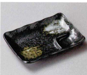
28118-671 天目白吹6.0仕切皿 600円 (17×11.5×2.7cm)