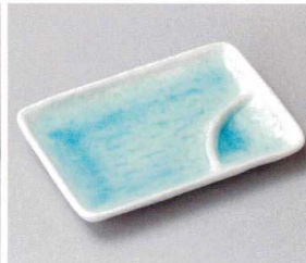
28102-091 湖白志野60仕切皿 880円 (17.5×12×2.2cm)