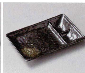
28107-671 天目白吹トンカツ皿 720円 (21.2×13.5×3cm)