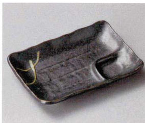
28110-541 黒マット一珍6.0仕切皿 700円 (16×11×2.5cm)