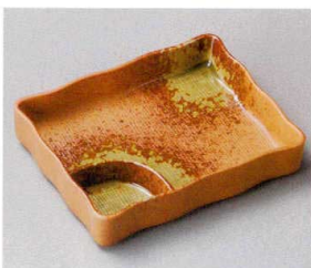
28114-641 伊賀仕切皿 720円 (14.8×11.7×3cm)