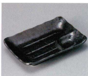
28116-181 黒釉6.0仕切皿 630円 (16.8×11.2×2.8cm)