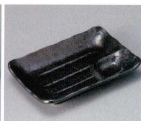
28116-181 黒釉6.0仕切皿 630円 (16.8×11.2×2.8cm)