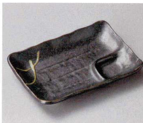
28110-541 黒マット一珍6.0仕切皿 700円 (16×11×2.5cm)