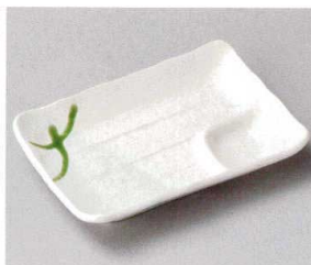
28111-541 白マット一珍6.0仕切皿 700円 (16×11×2.5cm)