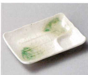
28120-671 白織部吹6.0仕切皿 600円 (17×11.5×2.7cm)