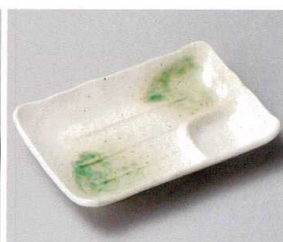
28120-671 白織部吹6.0仕切皿 600円 (17×11.5×2.7cm)