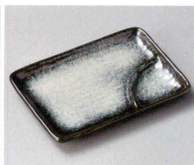
28112-571 雲竜6寸仕切り皿 730円 (18×12.3×2.4cm)