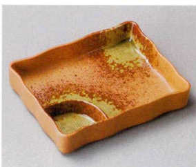
28114-641 伊賀仕切皿 720円 (14.8×11.7×3cm)