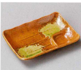
28119-671 伊賀6.0仕切皿 600円 (17×11.5×2.7cm)