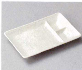
28105-671 粉引トンカツ皿 720円 (21.2×13.5×3cm)