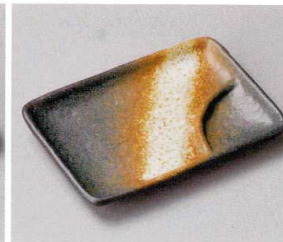
28103-091 黒備前6.0仕切皿 880円 (17.5×12×2.1cm)