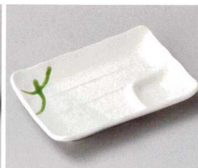
28111-541 白マット一珍6.0仕切皿 700円 (16×11×2.5cm)