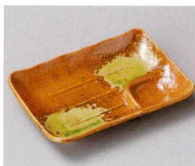
28119-671 伊賀6.0仕切皿 600円 (17×11.5×2.7cm)