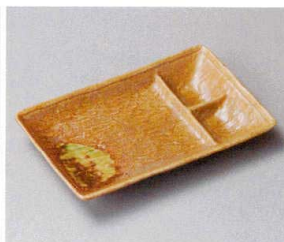
28106-671 伊賀トンカツ皿 720円 (21.2×13.5×3cm)