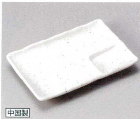
28109-331 粉引仕切り皿 700円 (17.4×12×2.6cm)