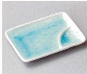
28102-091 湖白志野60仕切皿 880円 (17.5×12×2.2cm)