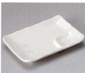
28115-181 粉引6.0仕切皿 650円 (16.8×11.2×2.8cm)