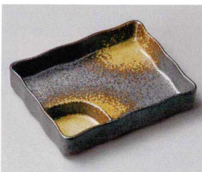
28113-641 黒伊賀仕切皿 720円 (14.8×11.7×3cm)