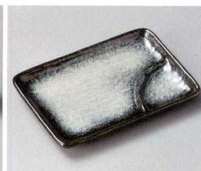
28112-571 雲竜6寸仕切り皿 730円 (18×12.3×2.4cm)