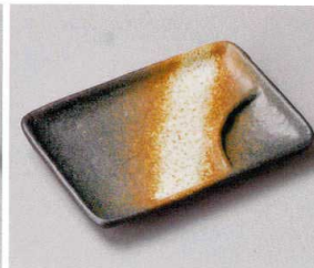
28103-091 黒備前6.0仕切皿 880円 (17.5×12×2.1cm)