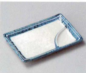
28117-131 瀬ライン6.0仕切皿 700円 (17×11×2cm)