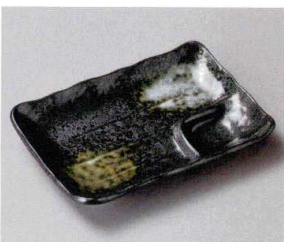
28118-671 天目白吹6.0仕切皿 600円 (17×11.5×2.7cm)