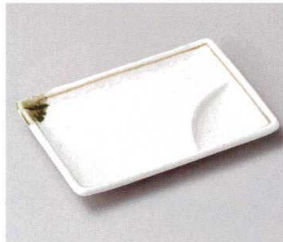
28101-091 志野ライン6.0仕切皿 880円 (17×11×1.7cm)