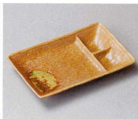
28106-671 伊賀トンカツ皿 720円 (21.2×13.5×3cm)