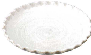
28506-461 手造粉引刷毛目10.0波洩丸皿 19,800円 (31×4cm)