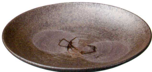
28513-431 黒窯変11.0ポタモチ丸皿 14,000円 (33×4cm) 28514-431 黒窯変13.0ポタモチ丸皿 19,500円 (39×5cm)