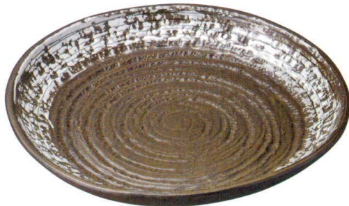
28511-651 黒茶渦三ツ足13.0皿 17,700円 (40×8cm)