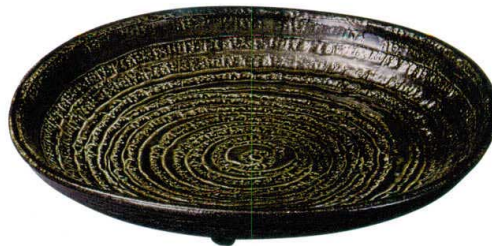
28509-051 茶オリベ10.0皿 6,300円 (30×5.5cm) 28510-051 茶オリベ13.0皿 18,500円 (40×8.5cm)