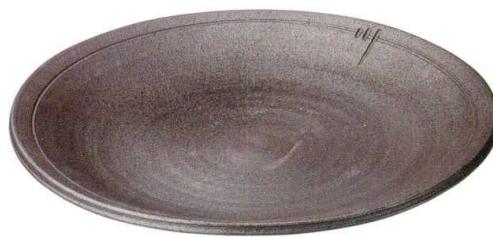
28515-431 炭化ロクロ目11.0大皿 11,500円 (33×5.5cm) 28516-431 炭化ロクロ目13.0大皿 17,700円 (39.5×6cm)