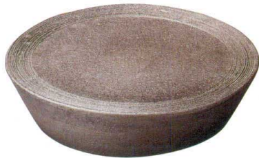
28507-431 黒窯変櫛目8.3台皿 17,600円 (25×7.5cm) 28508-431 黒窯変櫛目10.0台皿 20,000円 (30×7.5cm)