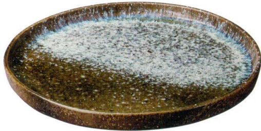
28503-431 ビード口窯変11.0皿鉢 7,500円 (33×2.5cm) (信楽焼) 28504-431 ビード口窯変13.0皿鉢 12,250円 (39×3cm) (信楽焼) 28505-431 ビード口窯変15.0皿鉢 20,000円 (47.5×3.5cm) (信楽焼)