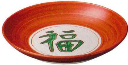
28501-071 福大皿 22,000円 (33.8×6cm)