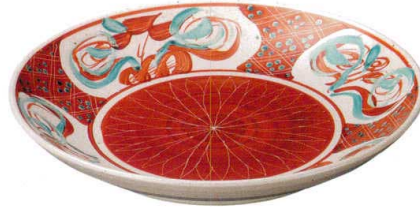
28502-071 万歴大皿 22,000円 (33.8×6cm)