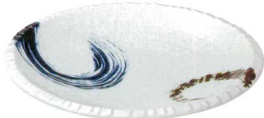
28905-161 濃刷毛尺皿 8,300円 (31×5cm)