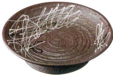
28909-541 南蛮掛10.0高台皿 8,000円 (31×8cm)