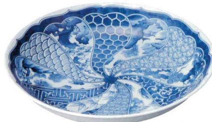
28913-641 祥瑞尺皿 5,300円 (31.5×12cm) 28914-641 祥瑞尺二皿 7,700円 (36.5×8cm)