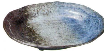
28910-331 三色流し足付大皿 7,350円 (30.5×30.5×4.5cm)