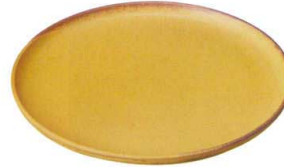
28903-451 満月平プレート(中) 4,400円 (20.8×1.8cm) 28904-451 満月平プレート(大) 6,500円 (21×1.8cm)