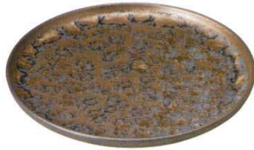
28901-451 宵の明星平プレート(中) 4,800円 (20.7×1.8cm) 28902-451 宵の明星平プレート(大) 7,500円 (21×1.8cm)