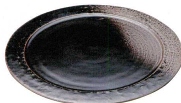
28917-471 萌花24cmリム皿 5,300円 (23.8×1cm) 28918-471 萌花31cmリム皿 7,000円 (31×1cm)