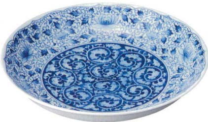
28911-641 濃唐草尺皿 5,300円 (31.5×12cm) 28912-641 濃唐草尺二皿 7,700円 (36.5×8cm)