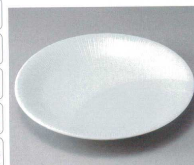
29015-671 青磁千段7.5皿 2,000円 (23.7×3.4cm) 29016-671 青磁千段尺皿 4,600円 (30.5×4.3cm)