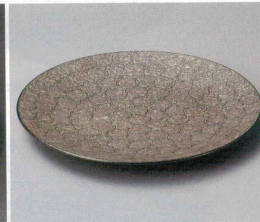
29014-161 黒林檎尺皿 3,850円 (30.7×3.2cm)