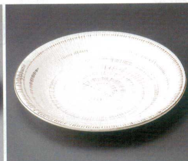
29012-161 錆粉引千段7.5皿 1,840円 (23.7×3.4cm) 29013-161 錆粉引千段尺皿 4,830円 (30.5×4.3cm)