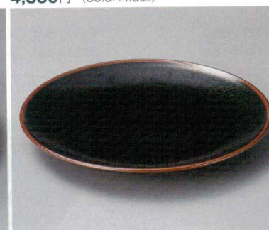
29017-011 ゆず天目10.0皿 4,500円 (31×4.2cm)