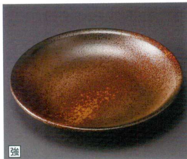
29001-461 古備前 10.0丸皿 6,800円 (29×4.5cm)