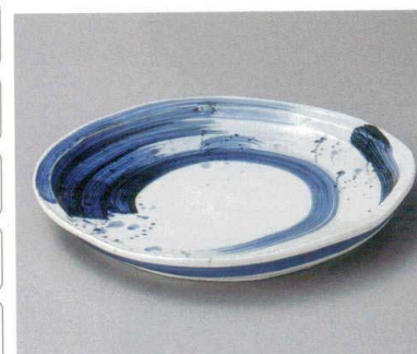
29011-10-541 呉須刷毛目変形尺皿 5,500円 (31×31×5cm)