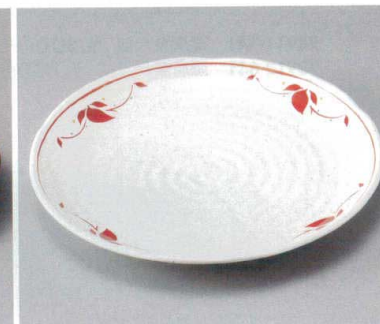
29018-671 粉引赤絵8.0皿 1,600円 (24.5×3cm) 29019-671 粉引赤絵10.0皿 3,000円 (30×3.3cm)