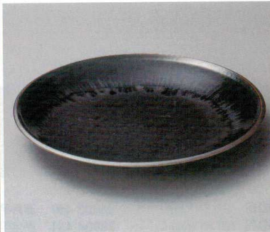
29002-161 緑彩8.0皿 1,330円 (25.4×3.5cm) 29003-161 緑彩9.0皿 1,870円 (28.5×3.8cm) 29004-161 緑彩10.0皿 4,100円 (31.2×4.5cm) 29005-161 緑彩11.0皿 5,900円 (34.8×4.9cm)