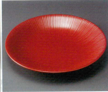
29006-161 千段朱7.5皿 2,070円 (23.7×3.4cm) 29007-161 千段朱尺皿 5,870円 (30.5×4.3cm)