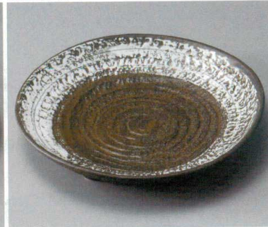
29010-651 黒茶渦三ツ足10.0皿 5,200円 (30.2×5.1cm)