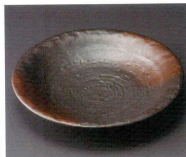
29008-641 備前風石目10.0深皿 5,400円 (32×5.5cm)