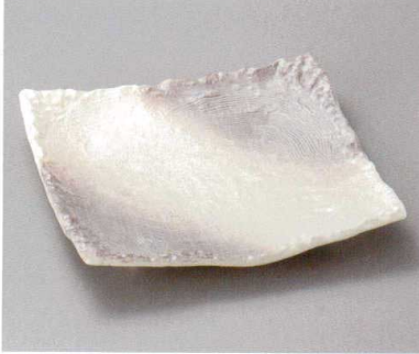
29313-48-711 かすみ志野8.0四ツ足正角皿 2,600円 (26×26×5.5cm) 29314-48-711 かすみ志野10.0四ツ足正角皿 4,000円 (31×31×5.3cm)