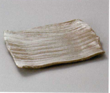
29322-481 雪志野10.0長角皿 3,500円 (32×23×3.3cm)