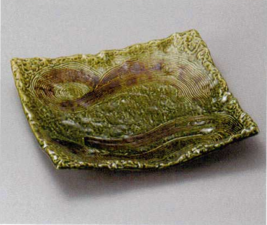
29319-48-711 織部8.0四ツ足正角皿 2,600円 (26×26×5.5cm) 29320-48-711 織部10.0四ツ足正角皿 4,000円 (31×31×5.3cm)