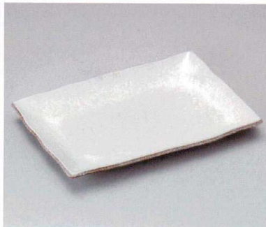
29305-711 うのふ掛分長角皿12号 5,400円 (37×26×4cm) 29306-711 うのふ掛分長角皿10号 3,800円 (31×21×3.5cm)