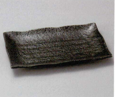
29323-481 油滴天目9.0長角皿 2,450円 (28.2×18.3×3cm) 29324-481 油滴天目10.0長角皿 3,000円 (30×21×3.3cm) 29325-481 油滴天目11.0長角皿 4,000円 (34.3×23.5×3.5cm) 29326-481 油滴天目12.0長角皿 5,600円 (37.5×26.5×3.8cm)