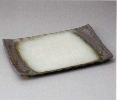
29327-711 風雅9号長角皿(手造り) 6,000円 (27.5×20×3.5cm) 29328-711 風雅13号長角皿(手造り) 12,500円 (41.5×29.5×4cm)