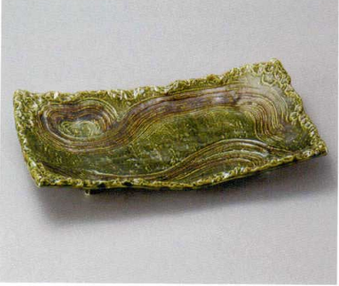
29317-48-711 織部10.0四ツ足長角皿 3,000円 (32.8×19.7×5cm) 29318-48-711 織部12.0四ツ足長角皿 5,500円 (37.8×24.5×6cm)