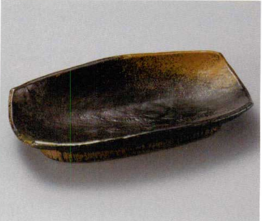
29321-481 琥珀10.0長角盛皿 3,200円 (31×18.5×5.5cm)