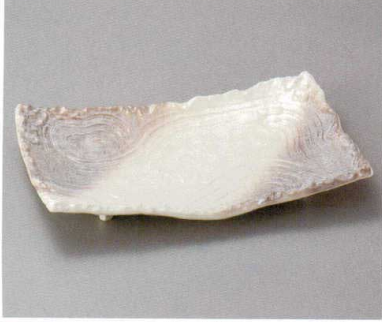
29311-48-711 かすみ志野10.0四ツ足長角皿 3,000円 (32.8×19.7×5cm) 29312-48-711 かすみ志野12.0四ツ足長角皿 5,500円 (37.8×24.5×6cm)