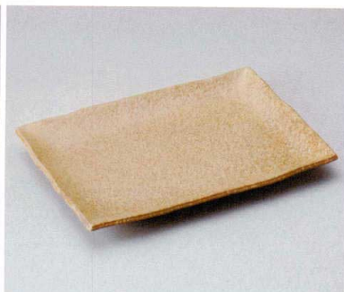
29307-711 黒茶吹12号長角皿 5,400円 (37×26×4cm) 29308-711 黒茶吹11号長角皿 4,600円 (33.5×23×4cm) 29309-711 黒茶吹10号長角皿 3,800円 (31×21×3.5cm) 29310-711 黒茶吹9号長角皿 3,000円 (27.5×18.5×3cm)