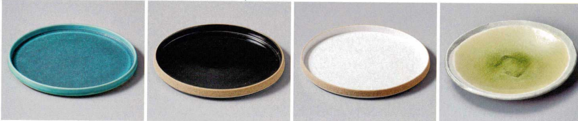
30311-101 トルコブルー切立丸皿(小) 3,200円 (18×2cm) 30314-101 潤コルク(黒)切立丸皿(小) 3,200円 (18.2×2cm) 30317-101 潤コルク(白)切立丸皿(小) 3,200円 (18.2×2cm) 30320-431 深海8.0丸皿 4,300円 (24.5×3cm) 30312-101 トルコブルー切立丸皿(中) 3,800円 (21×2cm) 30315-101 潤コルク(黒)切立丸皿(中) 3,800円 (21.3×2cm) 30318-101 潤コルク(白)切立丸皿(中) 3,800円 (21.3×2cm) 30313-101 トルコブルー切立丸皿(大) 4,500円 (24×2.1cm) 30316-101 潤コルク(黒)切立丸皿(大) 4,500円 (24×2cm) 30319-101 潤コルク(白)切立丸皿(大) 4,500円 (24×2cm)