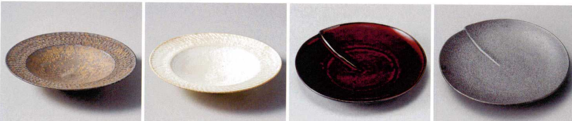
30321-021 金結晶7.0浅ボール 4,500円 (21.7×4.4cm) 30323-021 シェル釉7.0浅ボール 4,400円 (21.7×4.4cm) 30325-601 うるし釉ハス大皿 4,380円 (24.3×3.3cm) 30326-221 鉄ベッターハス大皿 4,350円 (24×3.8cm) 30322-021 金結晶8.0浅ボール 5,000円 (24.7×4.6cm) 30324-021 シェル釉8.0浅ボール 4,800円 (24.7×4.6cm)