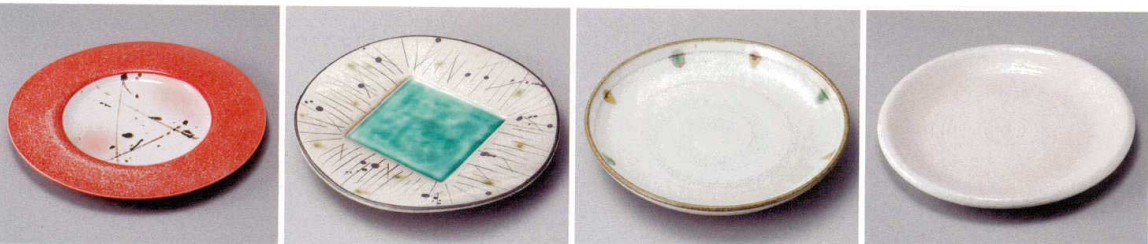
30331-471 赤釉錆絵8.5リム皿 4,150円 (25.8×2.8cm) 30332-181 雨音8.0前菜皿 5,050円 (24.8×3cm) 30333-031 かいらぎ水玉8.0皿 4,200円 (25×3.6cm) 30334-461 荒土御本手6.5丸皿 2,500円 (19.5×2.5cm) 30335-461 荒土御本手7.5丸皿 3,100円 (22.5×2.5cm) 30336-461 荒土御本手8.0丸皿 4,100円 (24.5×2.5cm)