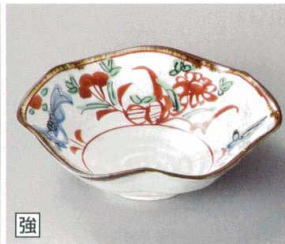
03102-451 赤絵魚紋向付 5,350円 (17×16.2×5.2cm)