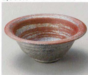
03111-431 暁5.3丸鉢(信楽焼) 6,500円 (16×7cm)