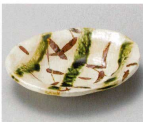
03119-471 タタラ草紋楕円向付 5,000円 (16.5×13.5×3cm)