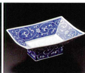
03109-471 染付濃唐草高台皿 5,200円 (20.5×15×7.5cm)