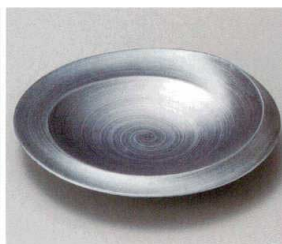
03120-101 銀彩渦巻向付 5,400円 (21.8×3.7cm)