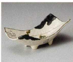
03114-331 黒織部四方上がり向付 5,000円 (25×10.5×8cm)