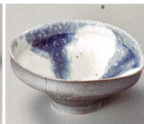
03113-011 内灰釉ナツメ型高台向付 5,050円 (17.5×14.5×8cm)