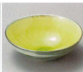
03116-431 黄緑5.6丸鉢 3,300円 (17.2×5.8cm)