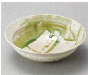
03118-431 ピロード流し7.0鉢 5,300円 (20×6cm)