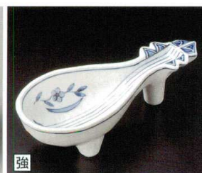
03117-471 びわ型皿 5,000円 (18.5×8×4.5cm)