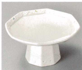
03110-051 ラスター点紋八角高台皿 5,400円 (16.3×8.5cm)