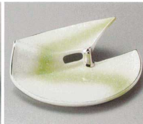
03103-471 ヒワ白吹二段前菜皿 5,300円 (22×19.8×7cm)