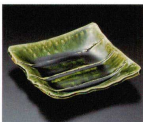
03115-471 織部しのぎ角皿 5,000円 (17.5×17.5×3.8cm)