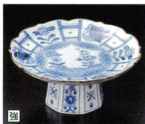
03105-461 染付芙蓉手高台向付 5,100円 (15.5×7cm)