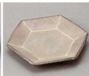
03121-471 三島網目六角皿 5,000円 (18×16×2.5cm)