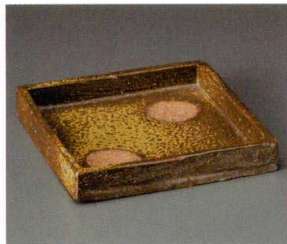
03101-181 備前風正角切立鉢 5,460円 (16.5×16.5×2.5cm)