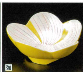
03108-461 黄緑二色一珍ラスター花形向付 5,200円 (14.5×5.7cm)