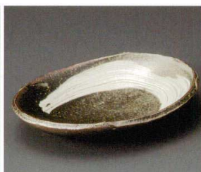
03106-431 刷毛目5.5楕円皿 4,000円 (16.5×13×3.5cm)