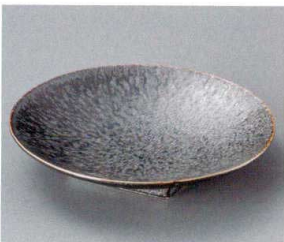
31109-30-471 白くじゃくとちり丸皿(大) 4,350円 (23×23×4.5cm)