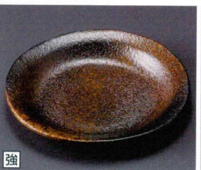
31123-461 古備前(布目)6.0深丸皿 2,600円 (18×2.5cm)