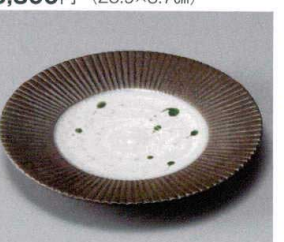
31126-471 炭化土織部とぼし7.5皿 3,000円 (22.2×3.2cm)