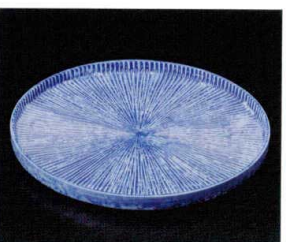
31111-541 インディゴブルー鑄6.0平皿(切立) 3,600円 (18.7×1.8cm)