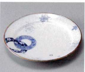
31110-461 染付春秋丸紋7.5丸皿 4,300円 (23.5×3cm)