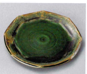
31116-181 織部ソギ7.5和皿 3,900円 (23.3×2.2cm)