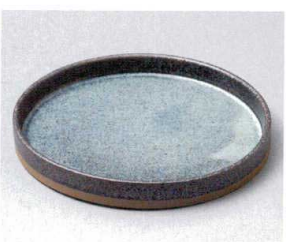
31107-471 外黒内グレー7.5切立プレート 4,500円 (22.5×2.5cm)