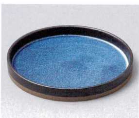
31106-471 外黒内ブルー7.5切立プレート 4,500円 (22.5×2.5cm)