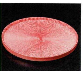
31113-541 ジャパレット鑄6.0平皿(切立) 3,600円 (18.7×1.8cm)