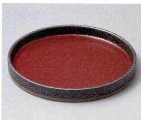
31105-471 根来赤7.5切立プレート 4,500円 (22.5×2.5cm)