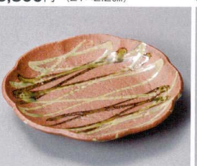
31125-051 信楽織部7.0皿 3,500円 (23×3.5cm)