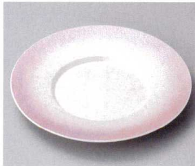
31101-181 ピンクスター24cm丸皿 4,600円 (23.9×2cm)