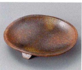
31115-181 手造り備前風高台7.0皿 4,050円 (21.8×4.2cm)