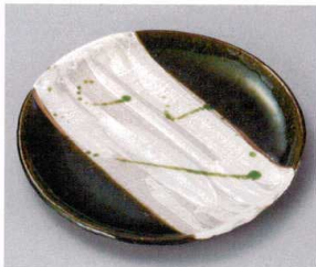
31102-121 織部掛け分たたら七寸皿 4,600円 (21.7×1.8cm)