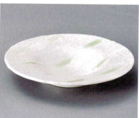
31104-181 ヒワ-珍帽子型和皿 5,500円 (21.3×3.2cm)