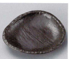
31108-011 炭化土縄淵6.3寸皿 4,440円 (21×18×3.3cm)