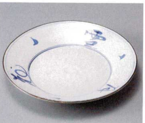
31121-361 染付雪月花6.0皿 2,600円 (20×3.3cm)