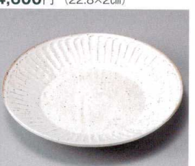
31119-361 粉引そぎ6.0皿 2,600円 (20×3.3cm)