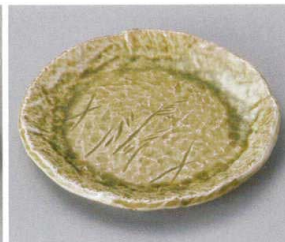
32018-151 灰釉手彫芦丸銘々皿 950円 (13.2×1.8cm)