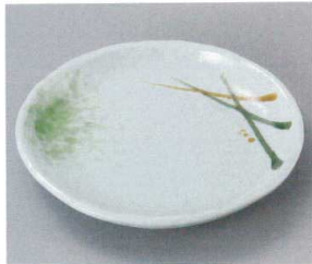
32001-051 美濃路玉淵6.5皿 2,200円 (20.5×3cm)