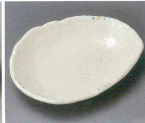
32024-191 点あそび7.0変形皿 1,200円 (20.5×16.3×3.4cm)