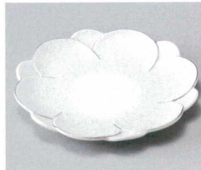
32011-541 潤プラチナ白吹花型6.0皿 3,300円 (22.3×15.8×8.2cm)