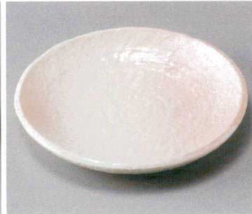
32013-461 桜志野7.0丸皿 1,890円 (20×3cm)