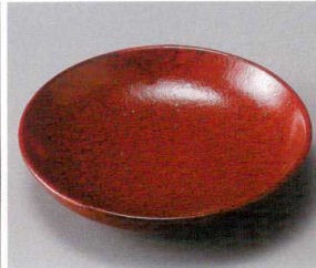
32008-021 赤結晶マグマ6.0おでん皿 2,000円 (18.5×4cm)