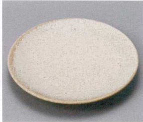
32006-541 絹衣6.0皿 1,430円 (19×2cm)