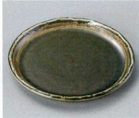
32010-321 織部ライン7.0丸皿 1,990円 (20.4×2.1cm)