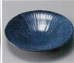
32026-021 花紺6.5多用鉢 1,150円 (20×4cm)