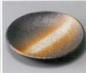
32012-461 いぶし備前 7.0丸皿 1,890円 (20×3cm)