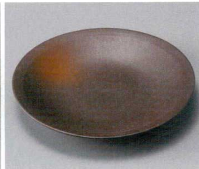
32022-651 黒伊賀6.0丸皿 1,300円 (19.1×2.7cm)