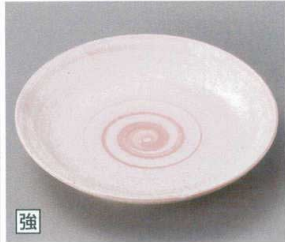
32002-121 春がすみ5.0皿 1,550円 (16.6×3cm) 32003-121 春がすみ6.0皿 2,200円 (19.3×3.3cm) 32004-121 春がすみ7.0皿 3,000円 (21.7×3.3cm)