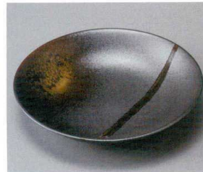
32023-511 南蛮吹流し6.0皿 1,280円 (20×3.7cm)