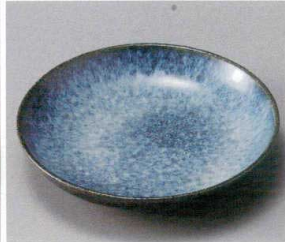
32009-021 青雲石6.0おでん皿 2,000円 (18.5×4cm)