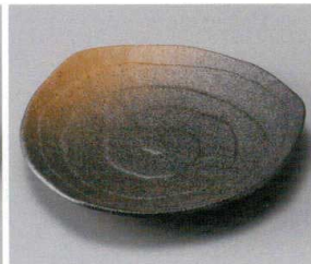
32020-631 黒備前三角5.0皿 800円 (16×16×2.5cm)