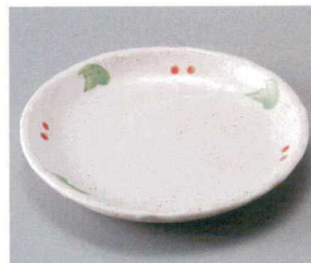
32015-021 桜志野4.5丸皿 1,000円 (13.8×2.4cm)