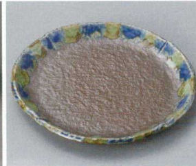
32025-321 きらめき6.0丸皿 1,190円 (18.4×2cm)