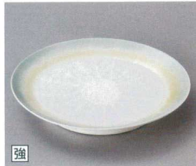
32007-231 春日吹新丸高台天皿 2,200円 (19.2×3.1cm)