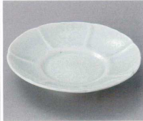
32014-121 青磁花彫6寸皿 1,800円 (18.7×3.5cm)