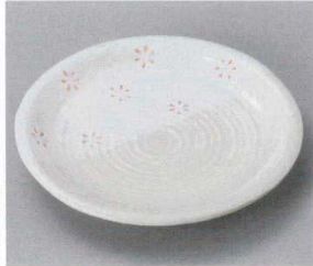
32005-321 粉引|小紋6.5丸皿 2,200円 (19.3×2.5cm)