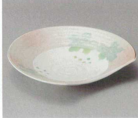
03403-181 ラスターぶどう半月向付 5,300円 (19×16cm)