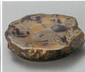
03416-301 金彩プレート皿大 4,400円 (17×15×4.5cm)