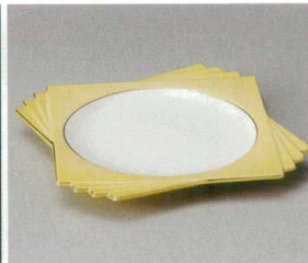
03411-181 黄釉四ツ重ね前菜皿 4,450円 (20×20×3cm)