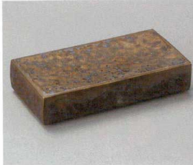
03401-021 金結晶ボックス皿 5,500円 (19.5×10×4.8cm)