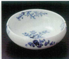
03407-471 薄青磁染付くつ型丸向付 4,500円 (15×5cm) 手造り