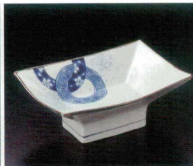
03410-541 染付春秋丸紋長角高台向付 5,000円 (20.2×14.3×7.2cm)