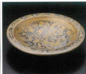
03414-451 宵の明星リムプレート 4,400円 (19.3×4.2cm)