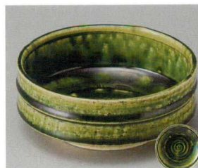
03413-121 総織部アヤマ丸4.0鉄鉢 4,400円 (12.5×4.8cm)