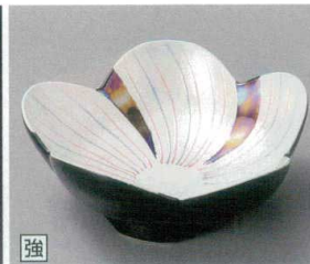
03415-531 黒釉二色・珍ラスター花形向付 4,400円 (14.5×14×5.5cm)