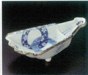
03412-461 染付春秋丸紋半開扇向付 4,400円 (22×12×5.5cm)