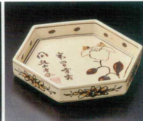
03420-471 乾山山茶花六角6.0皿 4,400円 (20×17.5×3.5cm)