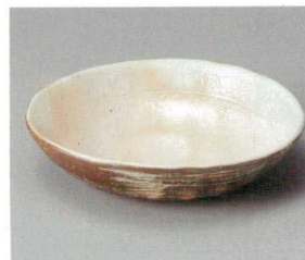
03417-431 荒土しのぎ手5.5丸鉢 5,000円 (16×4cm)