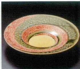
03406-471 さびうず7.5皿 4,500円 (23.5×4cm)