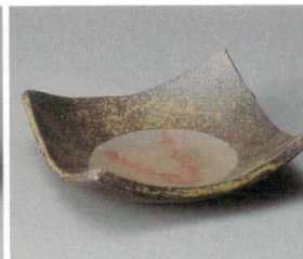
03418-431 炭化四角そり皿 4,500円 (15×15×4cm)