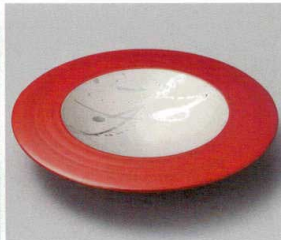
03408-471 測朱内プラチナ向付 4,500円 (18.7×3.6cm)