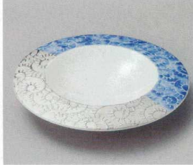
03404-471 プラチナ唐草丸向付 4,500円 (18.5×3.5cm)