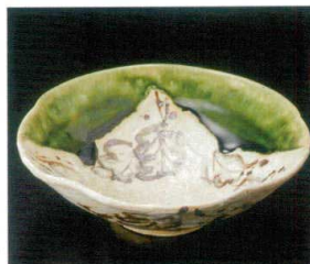
03409-471 織部草紋しぶ入り花型6.0鉢 4,500円 (18×6cm)