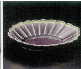
03419-471 紫ひわ線菊型楕円鉢 4,400円 (24.7×14×4.5cm)